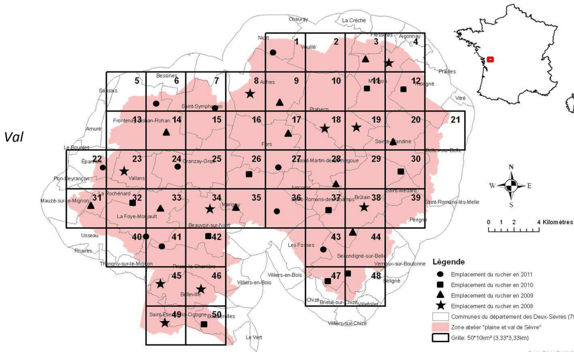
Figure 1 : "Zone Atelier Plaine et de Sèvre",