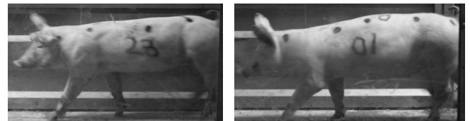
Figure 2 - Photographies d'un animal étiré (à gauche) ou contracté (à droite) entre les marqueurs 4 et 5

La déformation principale explique 17% de la variabilité (valeur propre 1,7 ; APG). Elle représente la courbure du dos, d'aplatie à arrondie. La déformation secondaire explique 13% de la variabilité (valeur propre 1,3). Elle oppose un étirement du dos entre la scapula et la 3ème côte à une contraction de cette zone (Figure 2). Les deux déformations permettent donc une bonne représentation de la variabilité. Une position élevée du cou et de la queue est associée à un niveau d'activité élevé chez le cheval (Kiley Worthington, 1987).