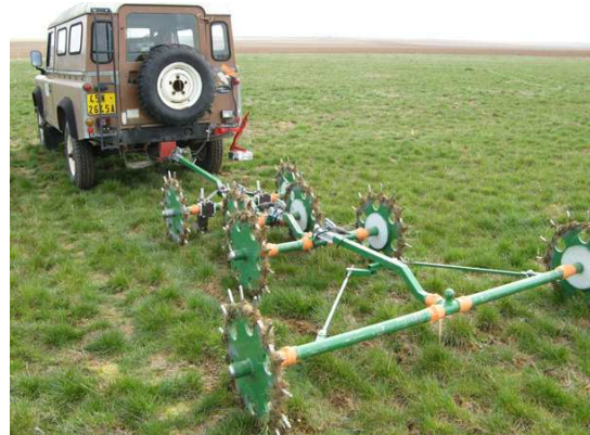
Fig. 1 – Système GPR (gauche) et géoélectrique MUCEP (droite).

La partie traitement des données et algorithmique a consisté à identifier les meilleures solutions de filtrage et de transformation des signaux permettant d'aboutir à une interprétation fiable des mesures géophysiques enregistrés. Ceci a été particulièrement important pour traiter les données sismiques ou corriger les images hyperspectrales (STEVENS, 2010), comme illustré sur la figure 2. Des algorithmes d'inversion furent finalement appliqués afin d'estimer les propriétés géophysiques expliquant les données. Ainsi, la stratégie de traitement proposée utilise plusieurs techniques, suivant la méthode envisagée :