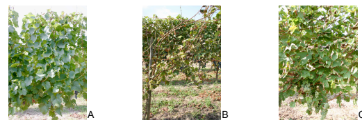
Figure 2 : Développement comparé au vignoble de la variété sensible chardonnay avec une protection phytosanitaire (A), de la variété sensible chardonnay sans protection phytosanitaire (B) et d'une sélection résistante sans protection phytosanitaire (C).

Les premiers génotypes créés dans le cadre de ce programme (pop 50001) ont été installés dans le réseau stade 1 en 2004. La vigne nécessitant 3 années pour la formation des souches et la mise à fruit au vignoble, nous avons pu effectuer les premières observations en 2006 (Figure 2). Pour cette première population, nous avons décidé d'installer, outre les témoins vinifera (chardonnay et merlot), quelques génotypes sensibles. Cela nous permet de comparer l'évaluation phénotypique sur la totalité de la gamme de sensibilité-résistance. La Figure 3 donne par exemple la relation entre les implantations de Colmar et Bordeaux pour la résistance au mildiou. Il apparaît une bonne cohérence dans l'ensemble, mais pour quelques génotypes il y a plus d'une classe de différence entre les deux lieux. Cela peut indiquer une interaction particulière, liée à la nature des souches de mildiou présentes et/ou aux facteurs de résistance.