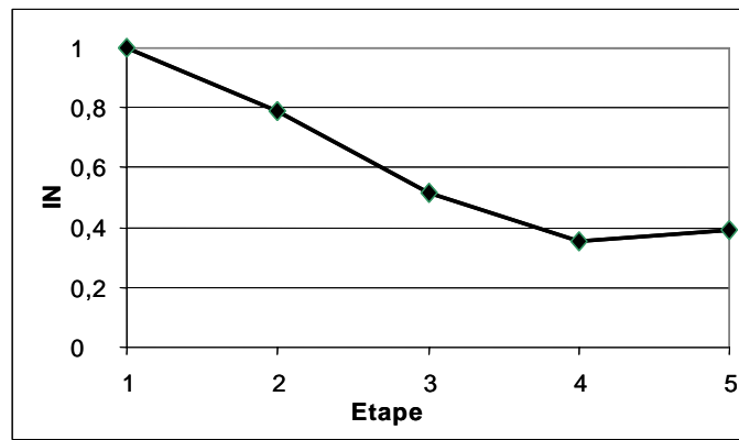
Figure 2. Évolution de l'indice de négociation

Des indicateurs calculés à partir de ce diagramme permettent d'analyser les évolutions du projet et de définir un Indice de Négociation IN (Fig. 2).