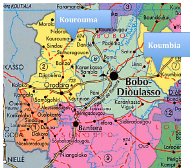
Figure 1 : Localisation des villages

Dans la région de Bobo Dioulasso (figure 1), dans les années 1980, l'essor du coton a provoqué une subite augmentation de l'emprise agricole (Vall et al 2006). Cette extension fût amplifiée par l'adoption de la traction animale et par l'installation de nombreux migrants Mossi. Les bonnes terres furent progressivement toutes occupées. Le coton occupa une part croissante de l'assolement et le maïs se substitua aux céréales traditionnelles. L'agriculture gagna sur les terres marginales (collines, bas-fond) réservées jusque là au pâturage. L'espace pastoral commença à se réduire. Les premiers conflits entre éleveurs et agriculteurs apparurent à cette époque (installation des champs sur des parcours, dégâts des troupeaux sur les cultures).