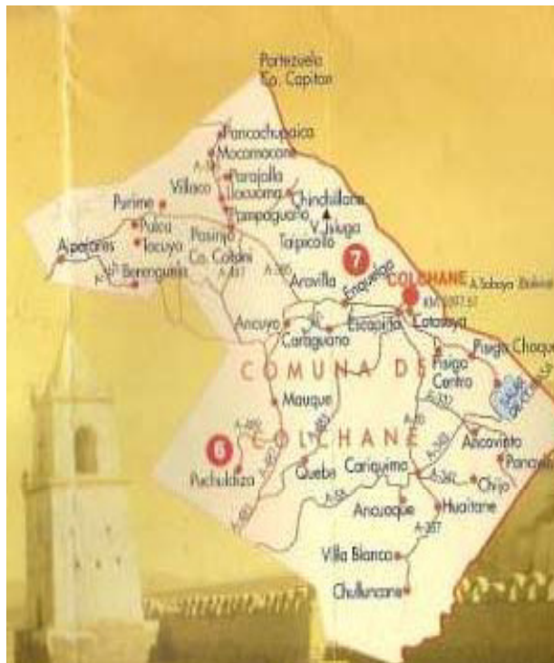
Figure 3 : Commune de Colchane

Le village de Colchane (Colchane-ville par la suite) est plus récent que les autres communautés, vieilles de plusieurs siècles. Il a été fondé à la fin des années 1970 durant le gouvernement militaire qui a installé dans ce poste frontalier administration, infrastructures et institutions (municipalité, jardin d'enfants, école et collège, dispensaire médical...). L'Etat reste le principal employeur de la commune. Les principales activités des populations locales sont l'agriculture, principalement la culture de la quinoa, productions maraichères, et l'élevage de camélidés ainsi que tourisme (accueil, hébergement, artisanat...).