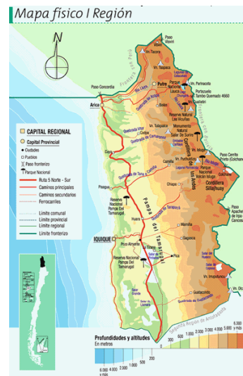
Figure 1: Région de Tarapaca

Elle est subdivisée en 5 zones géographiques (figure 2) : i) La Côte , bordant l'océan Pacifique, avec de grandes étendues plates et sableuses comme celles où sont situées la capitale régionale Iquique et la ville d'Alto Hospicio (altitude : 0m- 500m) ;