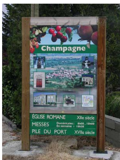
Champagne, mai 2005, C. Praly.