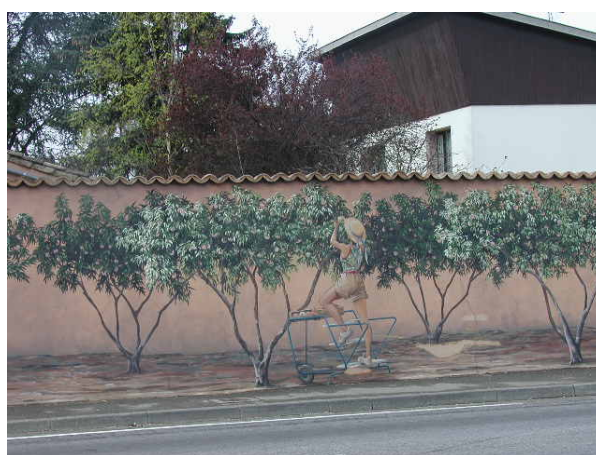
Fresque murale à Loriol-sur-Drôme, avril 2005, C. Praly.

En termes de mobilisation de l'arboriculture comme élément d'attractivité pour le territoire, ce sont l'histoire, les fruits ou les paysages qui sont patrimonialisés. Le cas de l'exposition permanente « 100 ans de culture du pêcher », de Beauchastel, montre bien une volonté de constituer cette culture historique en patrimoine local. D'autres cas mettent plus en avant les fruits, comme la commune de Mercurol qui revendique sa qualité de vie rurale et son « patrimoine de vins, fruits et de sa tour » 7 . De même, de nombreuses collectivités territoriales considèrent les fruits locaux, parmi les autres produits locaux, comme des arguments positifs capables d'attirer les visiteurs et touristes. A ce titre, elles soutiennent parfois financièrement les démarches de vente directe, censées animer le territoire. Le paysage façonné par les vergers est souvent vanté, notamment par la commune de Livron, ou la communauté de communes de Rhône-Valloire comme lieu de promenade. Enfin, une