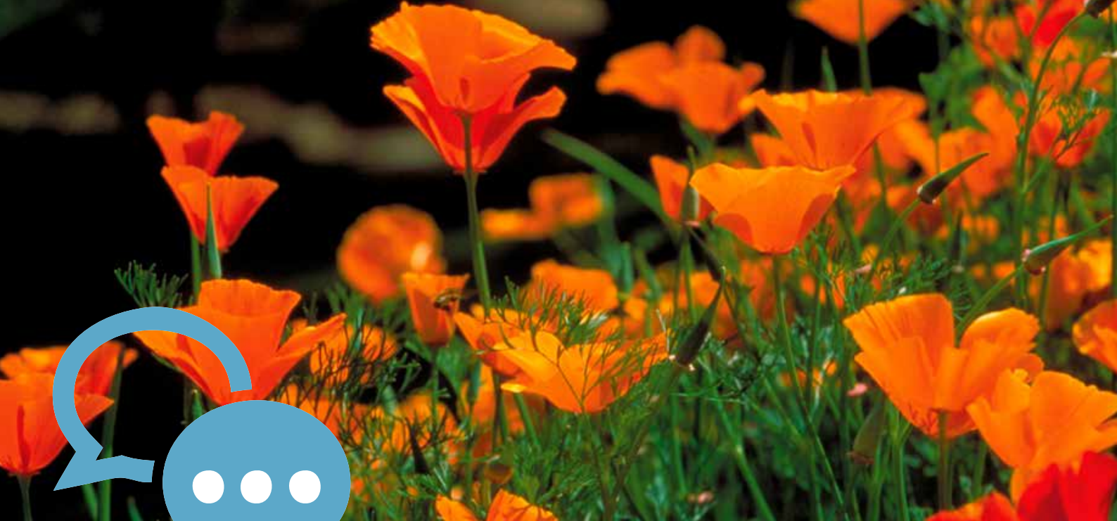
Pavots de Californie de mon jardin ( eschscholtzia ).