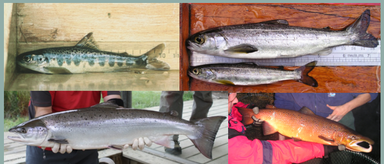
Figure 2 : Saumon juvénile « tacon » en rivière (en haut à gauche) ; « smolt » migrant vers la mer (en haut à droite), adulte revenant de la mer (en bas à gauche) et mâle au moment de la reproduction (en bas à droite).