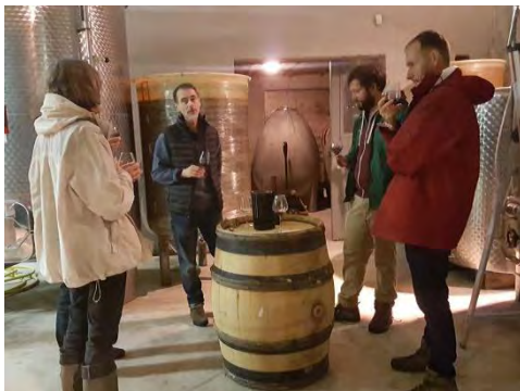
Dégustation au caveau

Le Climathon® a redémarré tôt le samedi, à 8h, par une séance de yoga ouverte à tous les participants. Si l'activité peut prêter à sourire, elle fut très appréciée par les participants qui avaient accepté de se lever tôt.