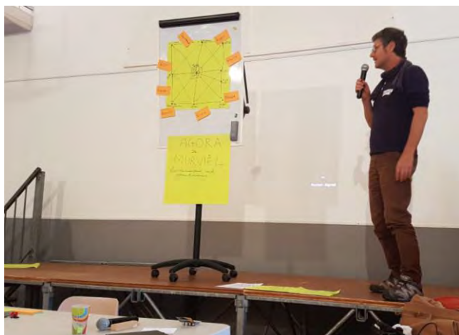
Présentation de l'Agora citoyenne

Le projet du groupe a alors changé de nature et d'échelle en proposant de développer une "agora citoyenne de Murviel" pour favoriser l'émergence de projets permettant de mettre en œuvre sur le territoire de la commune cette transition écologique inspirée de la permaculture. Il s'agit de mettre en relations les activités des diverses associations et des acteurs du territoire, de partager les expériences et les savoirs, de proposer des moments de créativité et de recherche de solution, à l'image même du Climathon® (une forme de pérennisation du Climathon® !). Le projet s'élargit donc à de nombreuses activités concernées par le changement climatique (atténuation des émissions de gaz à effet de serre et adaptation) et qui constituent l'écosystème local dans lequel évolue le vignoble et les viticulteurs. A travers une Agora des personnes et des projets, Murviel serait à même d'organiser une transition à grande échelle pour son vignoble et son territoire.