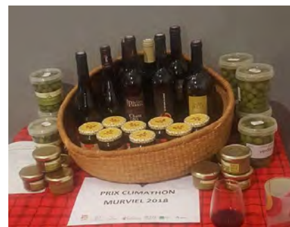
Prix du Climathon® de Murviel

La récompense a été constituée par un assemblage de produits locaux : meilleurs vins des 8 domaines de Murviel, olives, tapenades et miell. Le prix était présenté à tous durant les 24h. Il est apparu important d'avoir un prix "partageable" puisqu'il concerne une équipe dont la taille n'est pas forcément connue à l'avance... et qu'il faut prévoir la possibilité de deux projets primés (ce qui a été le cas).