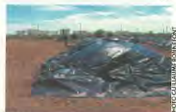
Les terrains de l'ancienne raffinerie d'Exxon Mobil à Frontignan, en cours de dépollution, accueilleront une gare et des bureaux.