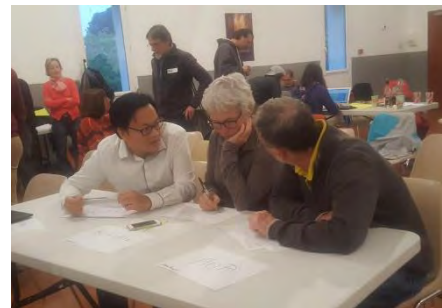
Délibération du Jury