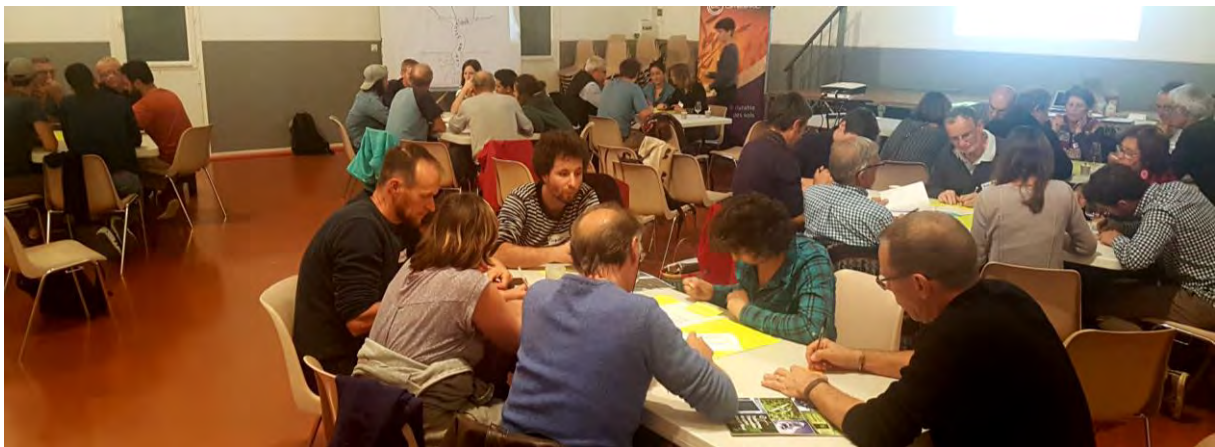
Les participants en plein World Café

Le World Café se déroule en 3 phases : la première pour lister les problèmes en lien (ou non) avec les deux thèmes proposés, une deuxième pour approfondir au moins un des problèmes évoqués (causes, conséquences, contexte...), et une dernière phase pour identifier une ou plusieurs solutions à ce problème, qui pourraient être développée à Murviel.