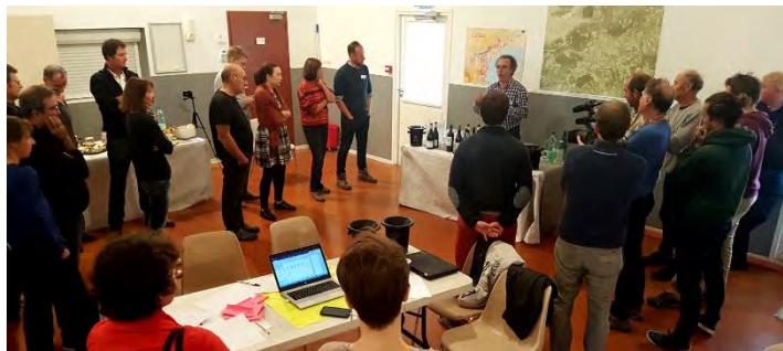
Dégustation de vin offerte par l'AOC Languedoc

L'objectif (entre 50 et 80 personnes) a été atteint et le nombre de participants s'est avéré bien adapté aux méthodes d'animation retenues (6 groupes, visites de terrain, séquences plénières) et aux capacités de la salle. Surtout, l'équilibre entre les catégories d'acteurs a été une condition forte du succès, en évitant un événement "trop professionnel viticole" ou "trop recherche". La diversité concernait aussi différentes "sensibilités", par exemple des approches agroécologiques plus ou moins marquées, des orientations plus ou moins techniques, une diversité de disciplines scientifiques pour les chercheurs... Le noyau dur des "31 travailleurs actifs" présents sur les 24h (avec une interruption de 6 h pour sommeil) a été suffisant pour assurer la continuité des actions, même s'il aurait pu être plus important. Il apparaît de fait difficile de mobiliser sur 24h un nombre important d'acteurs de