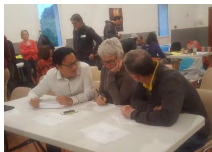
Délibération du Jury