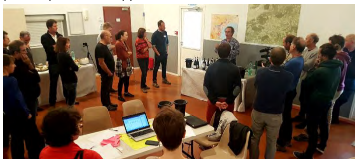
Dégustation de vin offerte par l'AOC Languedoc

L'objectif (entre 50 et 80 personnes) a été atteint et le nombre de participants s'est avéré bien adapté aux méthodes d'animation retenues (6 groupes, visites de terrain, séquences plénières) et aux capacités de la salle. Surtout, l'équilibre entre les catégories d'acteurs a été une condition forte du succès, en évitant un événement "trop professionnel viticole" ou "trop recherche". La diversité concernait aussi différentes "sensibilités", par exemple des approches agroécologiques plus ou moins marquées, des orientations plus ou moins techniques, une diversité de disciplines scientifiques pour les chercheurs... Le noyau dur des "31 travailleurs actifs" présents sur les 24h (avec une interruption de 6 h pour sommeil) a été suffisant pour assurer la continuité des actions, même s'il aurait pu être plus important. Il apparaît de fait difficile de mobiliser sur 24h un nombre important d'acteurs de