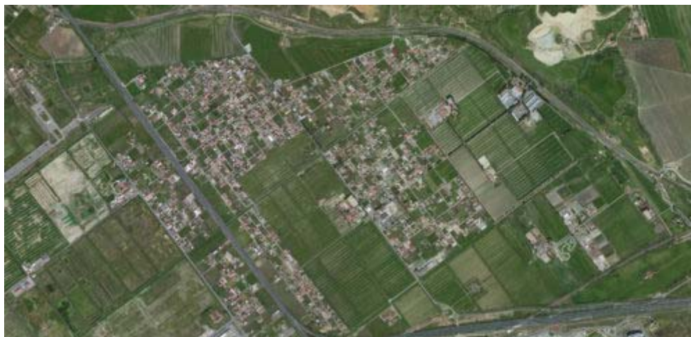
Fig. 2 – Piana del sole : le strutture agrarie storiche della bonifica sono ancora leggibili

Invece, i grandi progetti (aeroporto, autostrada, Parco Leonardo, fiera di Roma) ci si