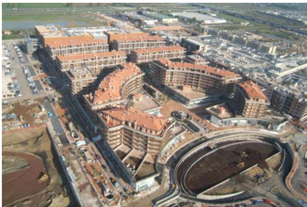
Fig. 3 – Parco Leonardo