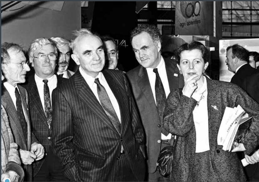
Visite du ministre de la Recherche sur le stand de l'Inra au Salon international de l'agriculture, 1991.