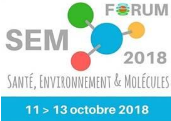
Table ronde : Pesticides et Alternatives