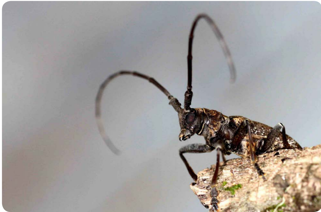
Coléoptère longicorne (espèce non-déterminée). Savane de Lamto. Côte d'Ivoire