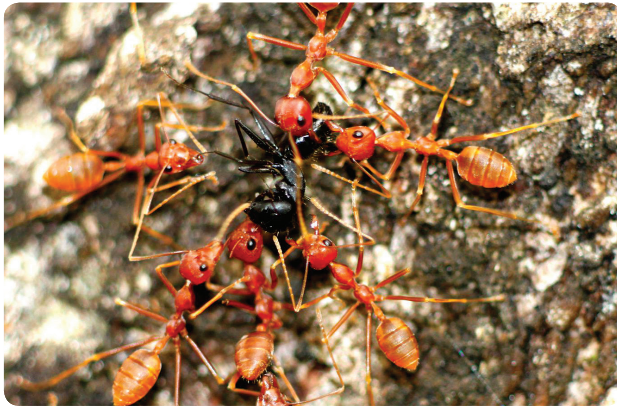
Fourmis écophiles transportant le cadavre d'une fourmi d'une autre espèce. Savane de Lamto. Côte d'Ivoire