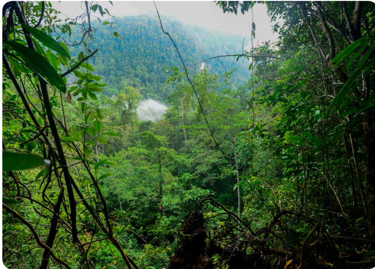
Lengguru 2014. Paysage de forêt tropicale humide. Papouasie