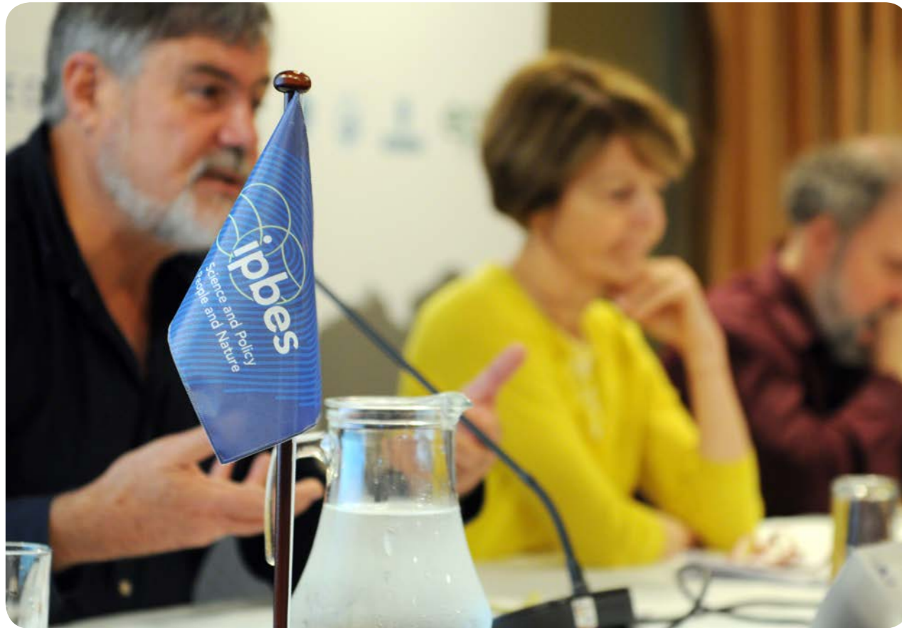
Discussion autour des rapports internationaux lors de la 6 e session plénière de l'IPBES, qui s'est tenue en mars 2018. Colombie