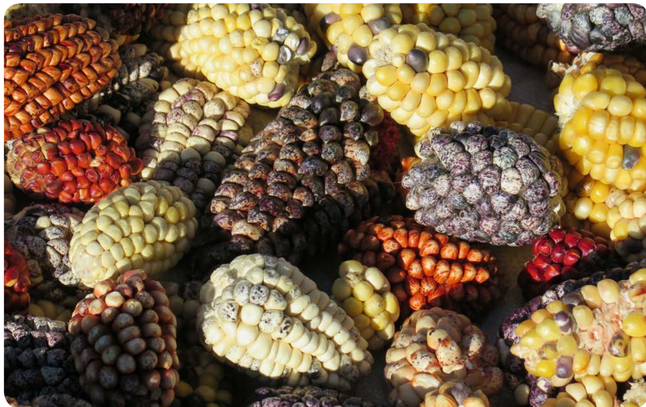
Diversité des maïs du Pérou, Pisac. Cuzco. Pérou