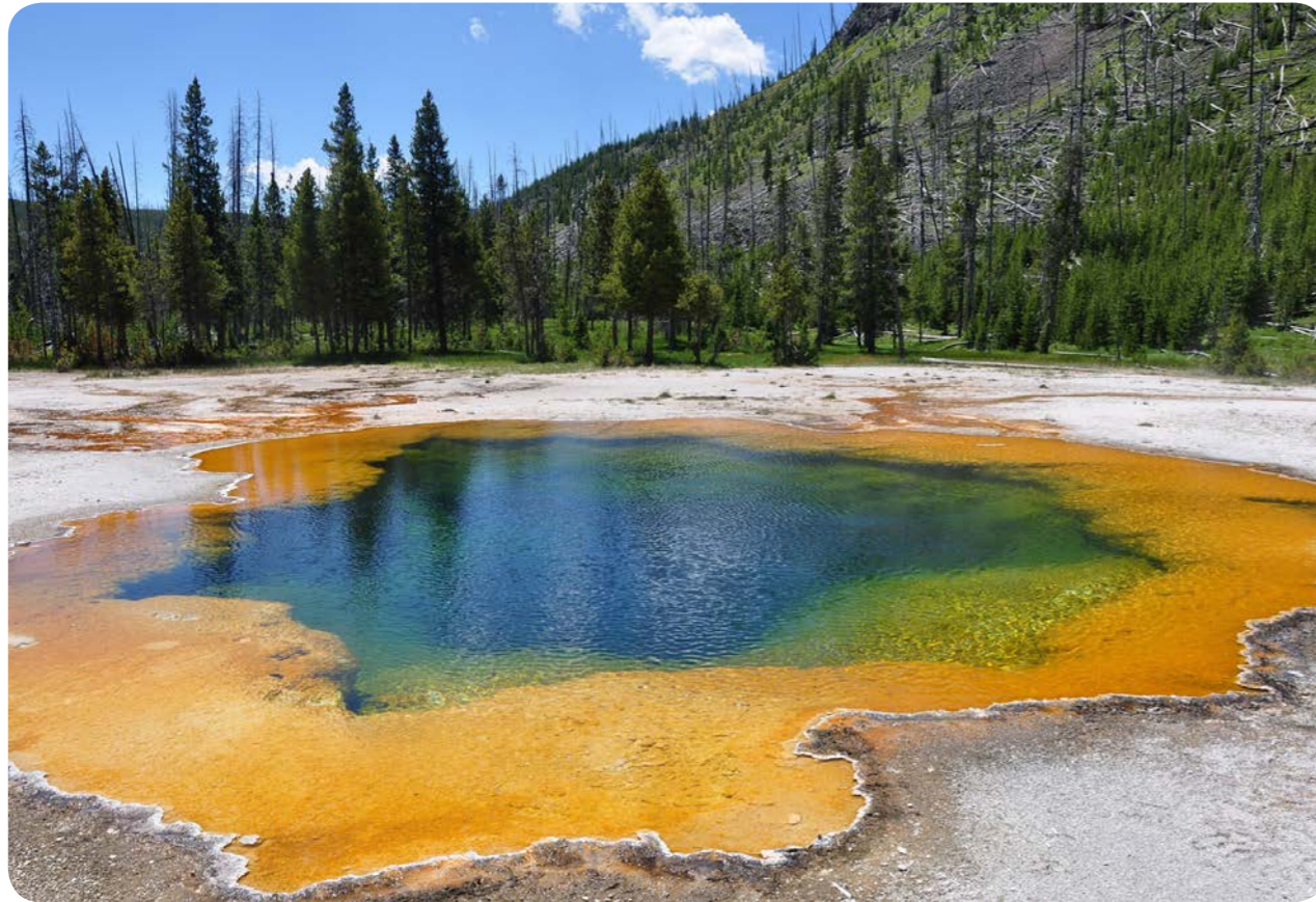
Geysir, source d'eau chaude. Parc de Yellowstone. États-Unis