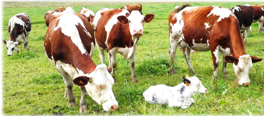
Veaux sous la mère pâturant avec le troupeau laitier

Améliorer le bien-être des animaux en élevage constitue actuellement un enjeu majeur, en réponse aux attentes des citoyens et consommateurs. En agriculture biologique, des réflexions sont en cours pour faire évoluer les pratiques d'élevage et ainsi permettre aux animaux d'exprimer au mieux leur comportement naturel. L'élevage des veaux en système laitier constitue un des points d'attention. En effet, pour l'heure, la séparation des veaux avec les mères reste la pratique la plus courante mais de nouvelles conduites d'élevage, qui privilégient le lien maternel, apparaissent. Mieux connaître ces pratiques, pour identifier les conditions auxquelles elles peuvent être adoptées par un nombre plus important d'éleveurs, a constitué le but d'une enquête menée au printemps 2018 auprès d'éleveurs bios qui élèvent les veaux avec des vaches adultes.