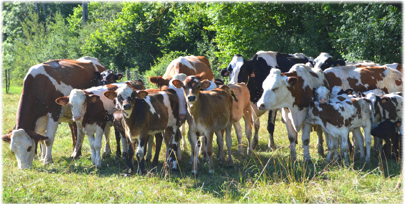
Lot de vaches nourrices et leurs veaux conduit au pâturage

Les facteurs exogènes favorisant les maladies infectieuses et digestives (tétine, température et quantité de lait) sont désormais mieux contrôlés. La mise au pâturage précoce des veaux avec les vaches favoriserait l'immunité des jeunes. C'est pourquoi, d'après les éleveurs, les veaux issus de ces élevages sont globalement en bonne santé. Aucun traitement n'est réalisé pour enrayer des cas de diarrhées ou le développement de parasites. Il y a donc moins de jeunes animaux malades et donc moins de frais vétérinaires occasionnés.