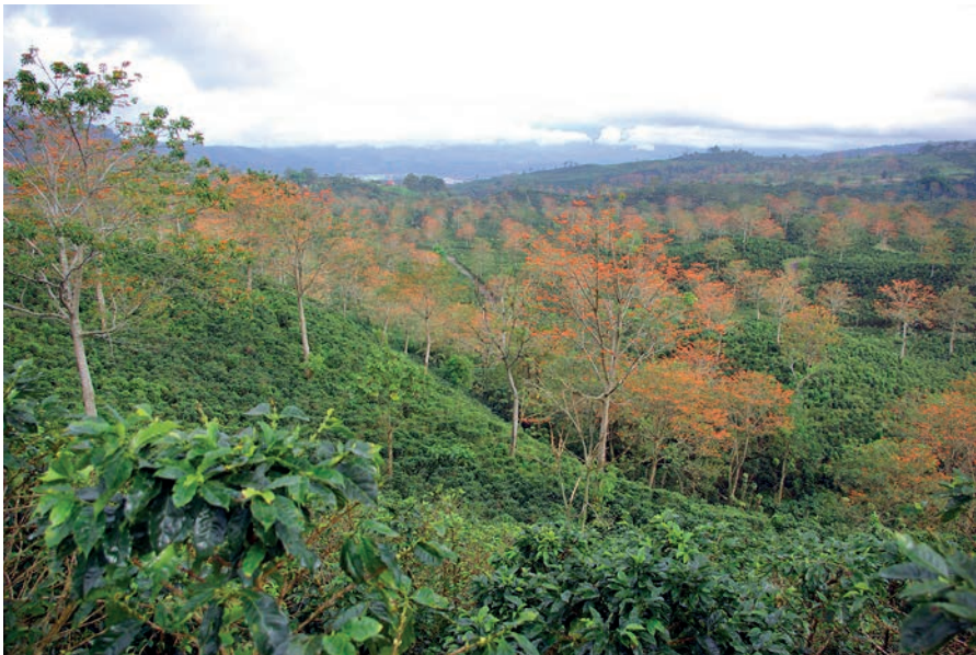
Figure 2.1. L'observatoire collaboratif CoffeeFlux dans la ferme d'Aquiaries : caféiers sous grandes érythrinae.

L'objectif de Coffee-Flux est d'évaluer les flux de carbone, d'eau, de nutriments, de N 2 O et d'érosion et de quantifier les services écosystémiques, de la plante jusqu'au bassin versant ou à la ferme. L'observation, l'expérimentation, la modélisation et la télédétection sont combinées. Les données sont collectées (fig. 2.2) et les modèles sont calibrés localement, de la plante à la parcelle (ha) avant de changer d'échelle (bassin, ferme). L'observatoire est suivi depuis 2009 afin d'appréhender les fluctuations saisonnières et interannuelles de la productivité du caféier et les services écosystémiques associés. L'observatoire Coffee-Flux a été soutenu en permanence par plusieurs institutions et projets, dont le projet Safse (Compromis entre production et autres services écosystémiques fournis par les systèmes agroforestiers, Cirad/IRD).