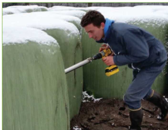
Figure 3 : Prélèvement sur balle fermée à l'aide d'une sonde

Les prélèvements simples sont ensuite rassemblés, homogénéisés pour obtenir un échantillon représentatif d'environ 500 g frais.