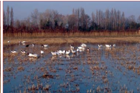
Photo 6 et 7. Troupeau de canards pâture les adventices dans la rizière au stade du tallage du riz sous la vigilance de M. Poujol (à gauche) et après la récolte (à droite)