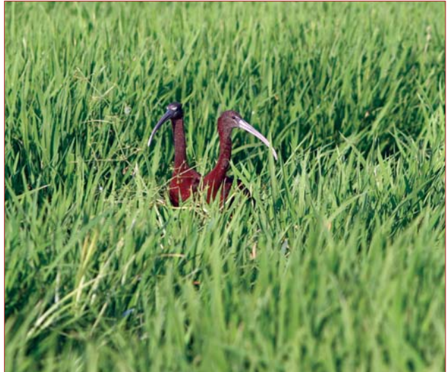
Photo 1. L'ibis falcinelle ( Plegadis falcinellus ) fait partie des espèces patrimoniales d'oiseaux utilisant très largement les rizières comme site d'alimentation au printemps

garde-bœufs ( Bubulcus ibis ), le héron crabier ( Ardeola