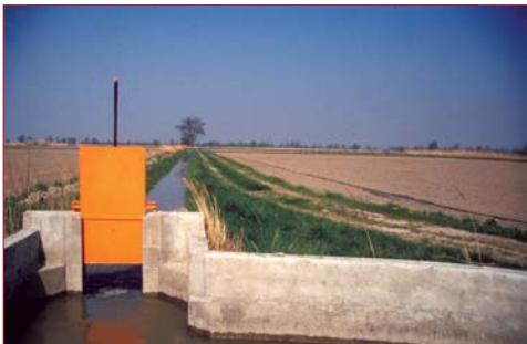
Photo 5. Canal d'irrigation équipé d'une vanne (martelière)

de l'installation de la culture (Barbier, ce volume p. 125) et un contrôle des adventices qui ne tolèrent pas la submersion (Marnotte & Thomas, ce volume p. 145). Cependant, pour réaliser pleinement ces fonctions, l'aiguadier devra intervenir quotidiennement (ph.6) tout au moins pendant la période délicate qui va du semis du riz jusqu'à la montaison pour adapter la hauteur de la lame d'eau en fonction de l'état de développement du riz, des conditions climatiques, des attaques parasitaires et des interventions culturales. Lorsqu'un ensemble de rizières (îlot) est submergé, le semis peut être effectué sur une lame d'eau dont la hauteur est proche de 5 cm. Au-dessus de cette hauteur, les vagues provoquées par le passage du tracteur risquent de déplacer et d'enfouir les semences; en dessous, le volume d'eau n'est pas suffisant pour nettoyer les roues du tracteur qui risquent de s'enliser.