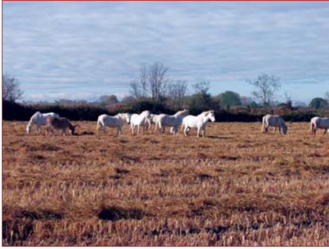
Photo 1. Chevaux pâturent des chaumes de riz