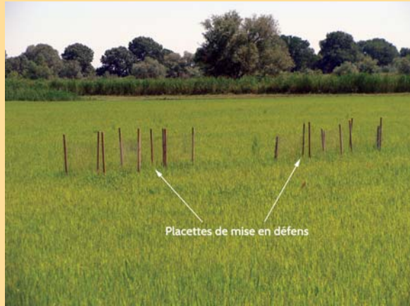
Photo 5. Positionnement des placettes de mise en défens dans la rizière pâturée par les canards