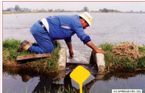
Photo 6. Intervention de l'aiguadier pour adapter la hauteur de la lame d'eau aux conditions de semis