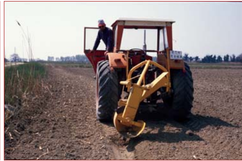
Photo 4. Tracteur équipé d'une rigoleuse