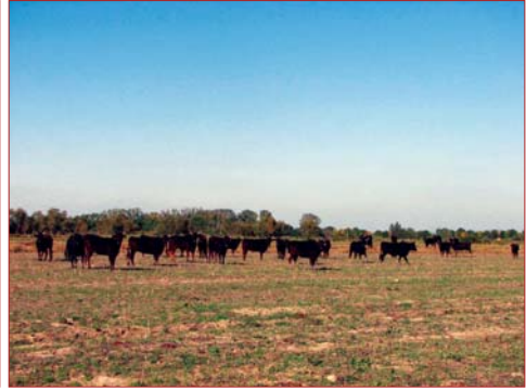
Photo 2. Taureaux camarguais pâturent en été des chaumes de blé

pâturent l'herbe des chemins, nettoient les fossés, consomment une partie des pailles, et apportent au sol un amendement naturel par leurs déjections.