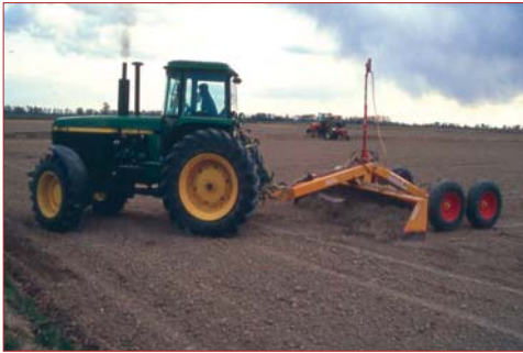
Photo 3. Surfaçage de la rizière avec une lame niveleuse assujettie à un rayon laser