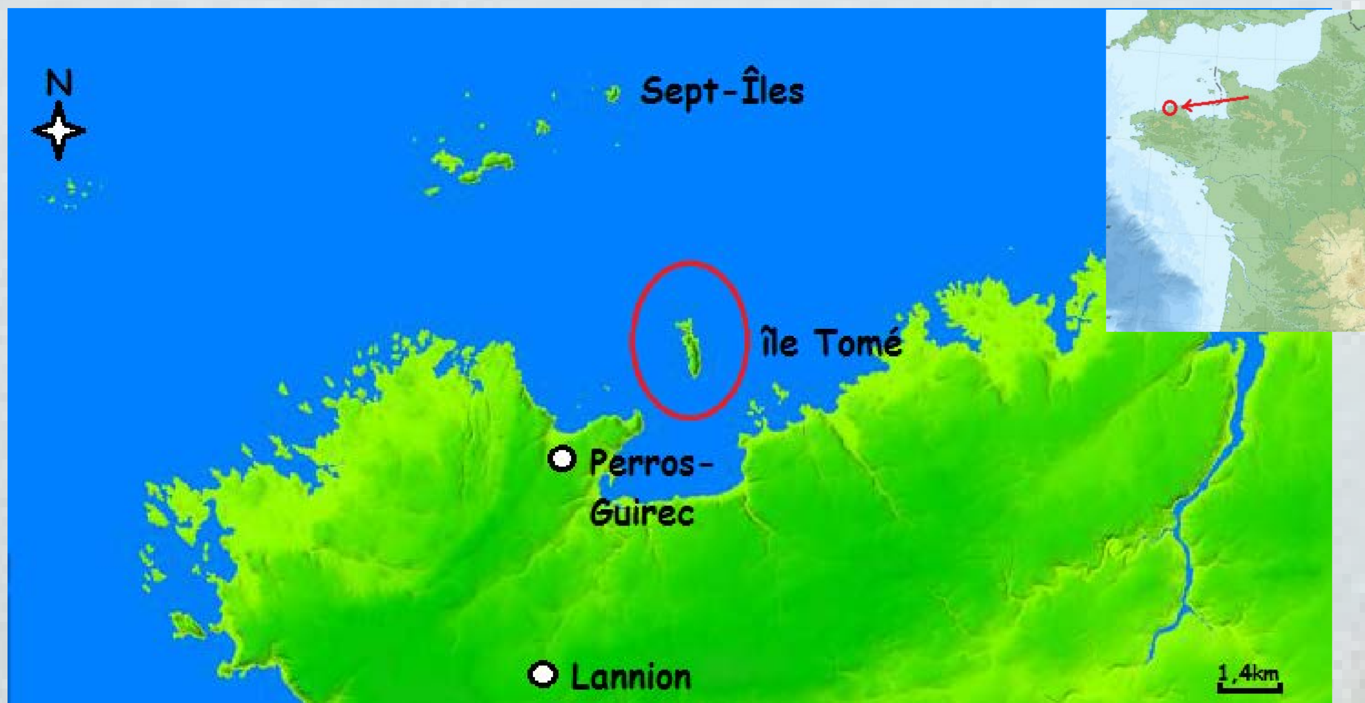
Situation géographique de l'île Tomé et des Sept-Îles