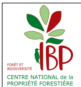
Fig. 2: Logo IBP ayant fait l'objet d'un dépôt de marque

Afin de pouvoir identifier l'IBP et éviter que la méthode ne soit dévoyée, un logo a été conçu (voir fig. 2) puis déposé à titre de marque sur le territoire français. Il sera accompagné d'un règlement d'usage avec rappel de la méthodologie de diagnostic.