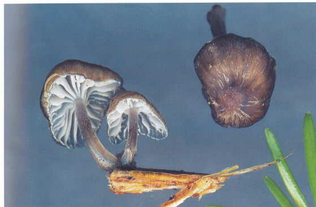
Mycena fuscoubilicata Robich & Cochard

Caro tenuis : odor paulum nitrosus. Stipes 1,3-1,8 \times 5-9 mm circiter; siccus, sursum cum pruina alba, brunneus aquose; basis haud inserta. Habitatio: super coniferae ( Abies alba ) truncum mortum in solo. Sporae 6-7,5 (8) \times (8,5) 9-12 \mu\text{m} , ellipsoideae late ellipsoideae, amyloideae. Basidia 8-10 \times 27-33 \mu\text{m} , 4-sp., clavata. Cheilocystidia 8-20 \times 32-60 \mu\text{m} , clavaeformia, fusioidea, utriformia, cum uno, duobus aut tribus tumoribus apicalibus 3-8 \times -22 \mu\text{m} crassis, flexuosis subcylindraceutis inconditis. Pleurocystidia non inspecta. Epicutis hyphae 2-6 \mu\text{m} latae, multum