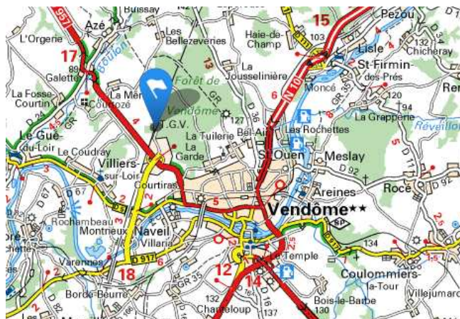
Carte de situation de la gare de Vendôme TGV