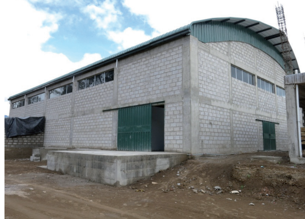
Imagen 4: Planta quinuera de la organización Coprobich en construcción en el año 2013

En Ecuador los mercados diferenciados de la quinua, comercio justo y orgánico, son manejados principalmente por fundaciones que gestionan a la vez proyectos de desarrollo con las comunidades y la comercialización. El mercado de quinua comercio justo y orgánico es de unas 500 toneladas por año, en su gran mayoría se exporta, solo pequeños volúmenes se venden en el mercado interno.