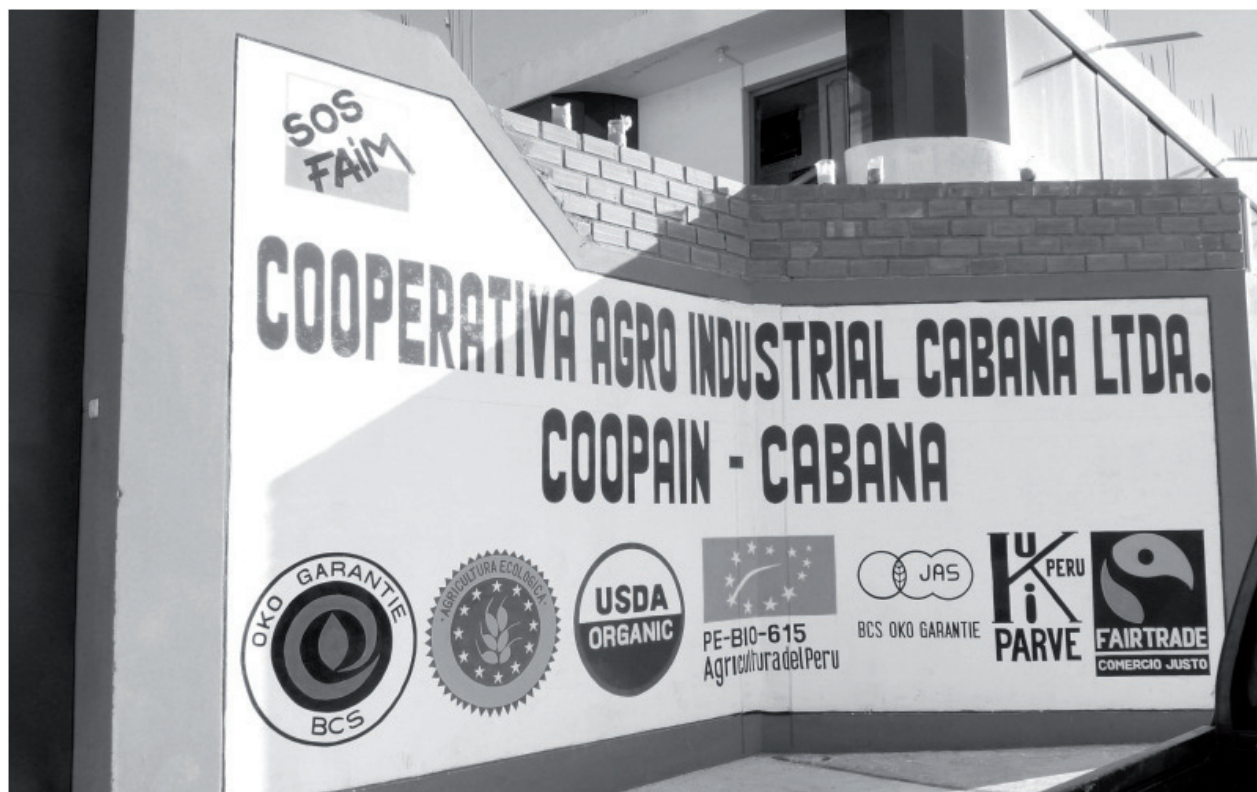
Imagen 3: Cooperativa COOPAIN-CABANA (departamento de Puno, Perú). © Aurélie Carimentrand, julio del 2012.

En el Perú, hay una sola organización certificada FAIRTRADE: la cooperativa Coopain Cabana en la provincia de San Román vecina a la ciudad de Puno (foto 2). Pero podemos observar que las certificadoras de la agricultura orgánica tienden a proponer sus propios sellos de comercio justo, como el sello FAIR CHOICE de Control Unión. Muchas veces, la certificación se realiza al mismo tiempo. En el Perú, los dos mayores exportadores de quinua tienen la certificación FAIR CHOICE. El principal exportador tiene además el sello FAIR FOR LIFE de IMO Control (certificadora suiza que tiene sede en Lima).