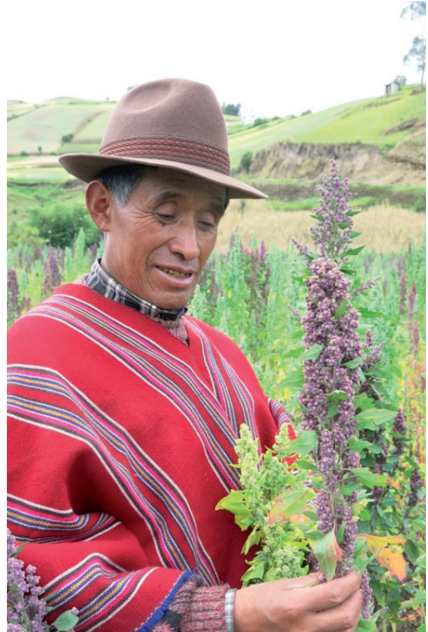
Imagen 2: Productor y dirigente quinuero de Chimborazo, Ecuador

la fecha no se ha vuelto a comprar quinua desde el Estado o por lo menos no de manera significativa.