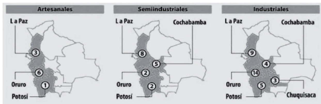
Figura 1: Plantas procesadoras de quinua por departamento y tipo en Bolivia.

facilitar la comercialización de la quinua real. Éstas contaron con el apoyo de ONGs extranjeras y se propusieron como objetivos mejorar las condiciones de vida de sus productores, a través de la obtención de mejores precios y de valor agregado integrando niveles en la cadena de la quinua al asumir su acopio, beneficiado, transformación parcial y comercialización. Estas organizaciones de segundo grado reúnen a varias organizaciones locales (Ayaviri & al. 1999; Healy 2001; Hellin & Higman 2003; Laguna 2011). La competencia de empresas privadas llegó pronto con Saite y Irupana en 1987, Jatariy en 1997, Quinuabol en 1998, Andean Valley en 1999, Quinoa Food en 2003, etc. En el país existen 62 plantas artesanales, semi-industriales e industriales de quinua (figura 1).