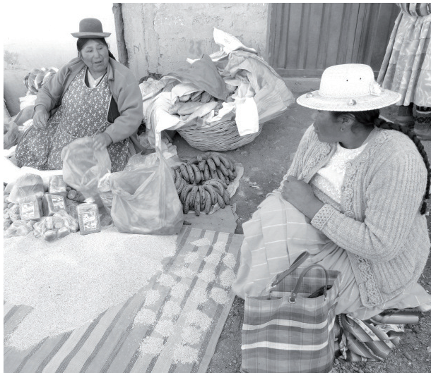
Imagen 1: Trueque de quinua contra pan en el altiplano peruano. © Aurélie Carimentrand (julio del 2012).

La mayoría de los productores de los Andes comercializan la quinua en las ferias semanales donde la unidad de medida es la arroba (11,5 kilogramos). En algunas zonas sigue viva la práctica del trueque (contra verduras, pan....) donde la unidad de medida es el puñado (Imagen 1).