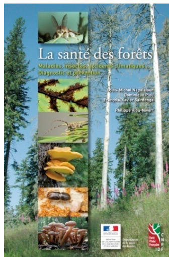
Figure 5. Pour aller plus loin : « la santé des forêts » ; ouvrage réalisé par le DSF et l’Institut pour le Développement forestier (IDF)