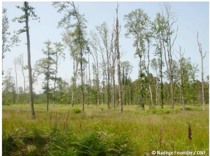
Figure 2. Peuplement de chênes dépérissants en forêt de Vierzon, à la suite de la canicule de 2003

Champignons pathogènes et insectes peuvent d'autre part être des agents primaires de dommages (fig. 3). Ainsi, plus de 300 espèces différentes d'insectes à l'origine de dégâts (près de 35000 fiches) sont répertoriées dans la base du DSF de 1989 à 2006. Toutefois, la plus grande part des dégâts incombe à un petit nombre de ces espèces: 13 espèces, parmi lesquelles beaucoup d'insectes sous-corticaux (qui se développent sous l'écorce) des résineux (scolytes) et des chenilles défoliatrices sont à l'origine de 60% des mentions. De même, les 17000 fiches de mentions de maladies correspondent à 206 espèces de champignons pathogènes, dont 13 sont à l'origine de 60% des mentions, parmi lesquelles des agents de pourriture des racines et du bois, des pathogènes foliaires et des agents de chancres corticaux ,( sur écorce et donc affectant tronc et branches).