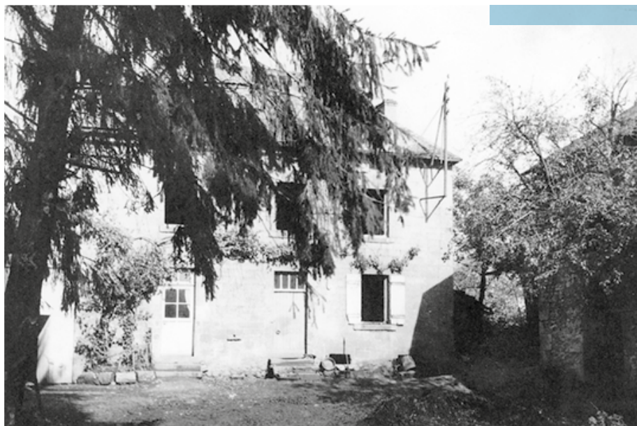
La ferme de mes grands-parents, « Les Bruges », ma maison natale en Creuse, toute solide de granite.

juives avaient dû porter l'étoile jaune ; elles ont heureusement pu échapper à toutes les rafles du moment. En vue d'un possible départ STO, j'avais dû passer le conseil de révision qui m'avait déclaré apte. Heureusement les dossiers afférents ont mystérieusement disparu, subtilisés par un mouvement de résistance. Quelques semaines, voire quelques mois ont ainsi été gagnés. Beaucoup d'autres épreuves et souffrances (pénuries alimentaires, maladies, froid...) ont marqué les quatre années d'occupation sur lesquelles je ne souhaite pas m'étendre plus avant. Je terminerai cependant l'évocation de cette sombre période par deux anecdotes plus amusantes. La première : nous suivions à l'Agro nos cours pendant les hivers dans des amphithéâtres non chauffés. On a relevé jusqu'à moins 2 degrés dans l'amphi, ce qui pourrait expliquer certaines écritures tremblotées dans nos cahiers de texte. La deuxième anecdote, plus opportuniste, procède de la menace STO devant laquelle mon père m'avait donné un conseil : « Pour éviter de te faire embarquer, la solution est d'entrer dans la police ». Sensible à sa sagesse, j'ai posé ma candidature. Je suis un ancien candidat à la préfecture de police de Paris.