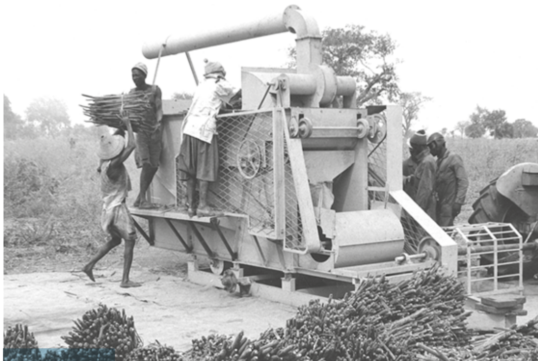
Une autre avancée par le moteur, bien trop ignorée : la « batteuse à mil », première machine capable de libérer la femme africaine d'un travail long, pénible et contraignant. Conçue sur un brevet Tourte-Plessard, une première série en est fabriquée, en septembre 1965, par la Société industrielle sénégalaise de Constructions mécaniques et de Matériels agricoles, Siscoma.