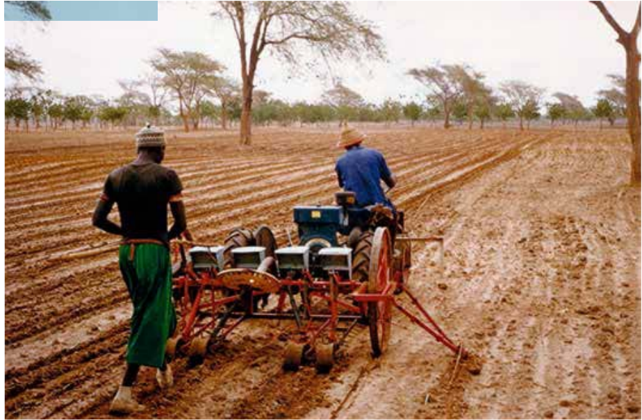
La traction animale, sans doute, mais déjà la petite motorisation : semoir à quatre rangs tracté par un motoculteur.

En fait, cette approche des indépendances a été très rapide à partir de la loi-cadre du 23 juin 1956 (dite Defferre) : autonomie interne en 1958 qui a vu s'instituer des conseils de gouvernement dont le vice-président et les ministres étaient des Nationaux ; référendum du 28 septembre 1958 approuvant la création de l'éphémère Communauté franco-africaine et de ses États-membres (hors la Guinée Conakry) ; d'avril à août 1960 pleine indépendance de tous ces États (le 4 avril pour le Sénégal).