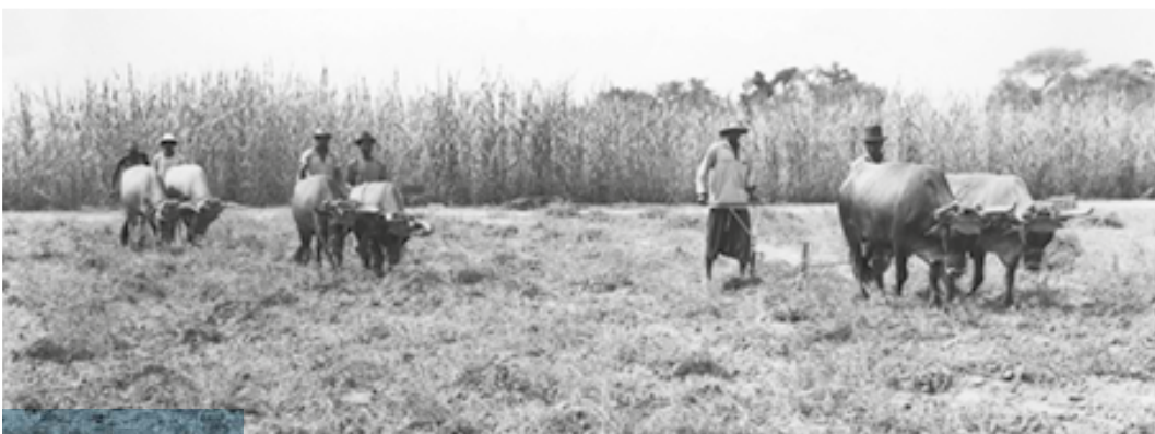
Priorité donc à la traction animale : l'arrachage de l'arachide.

Et dans cette longue marche vers les communautés rurales, vers les paysannats, je