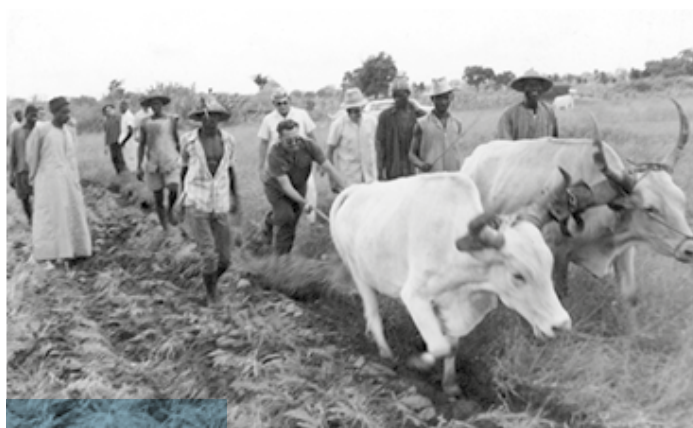
Les vieux réflexes creusois ressurgissent... « Le chef » au labour, en 1965.

La transition a été beaucoup plus souple et étalée sur plus d'une ou deux décennies. Dans mon cas personnel, rien n'était vraiment préfiguré, ni encore décidé vers 1970 pour mon retour en France. J'avais dès 1968-1969 engagé avec plusieurs de mes collaborateurs la lourde opération « Unités expérimentales » dans laquelle la recherche, portée par une équipe pluridisciplinaire d'une dizaine de chercheurs, intervenait directement au sein de communautés villageoises de plusieurs milliers de paysans et dizaines de milliers d'hectares. Je souhaitais accompagner ce grand projet innovant, au demeurant fortement soutenu par le gouvernement du Sénégal, véritable opération de développement expérimental.