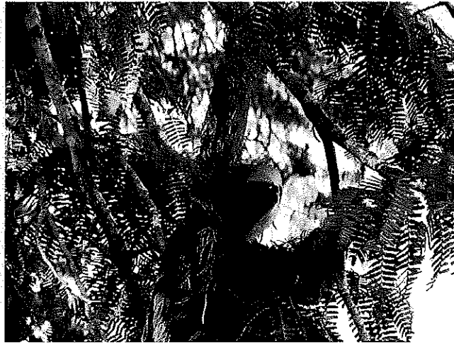
Paresseux, Amazonie

Des exemples issus à la fois de la réglementation et de démarches volontaires sont évoqués simultanément en utilisant des notions spécifiques, généralisées ou employées hors propos. Le terme « bio-banque » (biobank) par exemple, largement utilisé dans le reportage, désigne des initiatives précises sur les forêts (comme celle de la Malua BioBank mentionnée par les auteurs), concernant en particulier la compensation carbone. Ce terme ne doit pas être confondu avec celui de « BioBanking » (Biodiversity Banking and Offsets Scheme), programme de banques de compensation pour la biodiversité (espèces menacées) de l'Etat de Nouvelle-Galles du Sud en Australie, ni avec les « mitigation banks » (banques de compensation pour les zones humides) ou encore les « conservation banks » (banques de compensation pour les espèces protégées) américaines. Or ces projets et programmes renvoient à des systèmes de régulation très différents. (Nous invitons par ailleurs le lecteur à taper « biobank » ou « bio-banque » dans un moteur de recherche pour voir à quoi peut aussi renvoyer ce concept dans un tout autre domaine.)