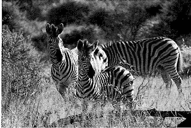
Zèbres de Burchell, Zimbabwe

Plus généralement le problème est celui-ci : malgré un vocabulaire marchand (crédits, banques, marchés), les opérations évoquées sont le plus souvent associées à des politiques publiques visant à protéger des actifs naturels non marchands. Par exemple, le terme de « banque de compensation » pour la biodiversité est utilisé comme synonyme de « réserve » d'habitats restaurés.