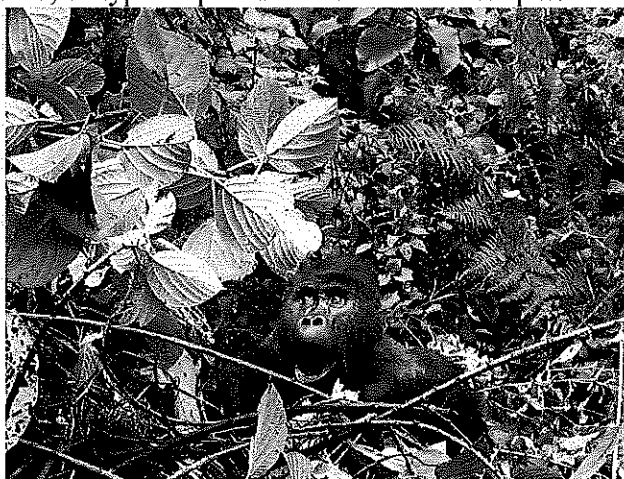
Gorille, Kivu, RDC

– L'évocation de fonds d'investissement qui proposent des « portefeuilles d'espèces » aux Etats-Unis. A notre connaissance, ce type de produit financier n'existe pas.