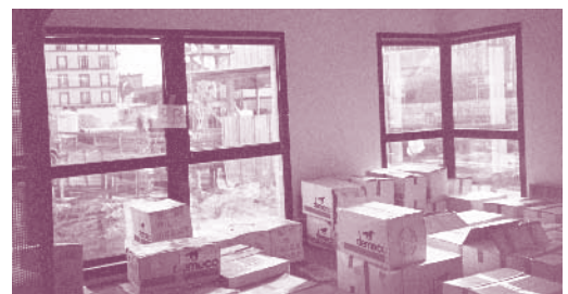
Bibliothèque d'Ivry, 1989.