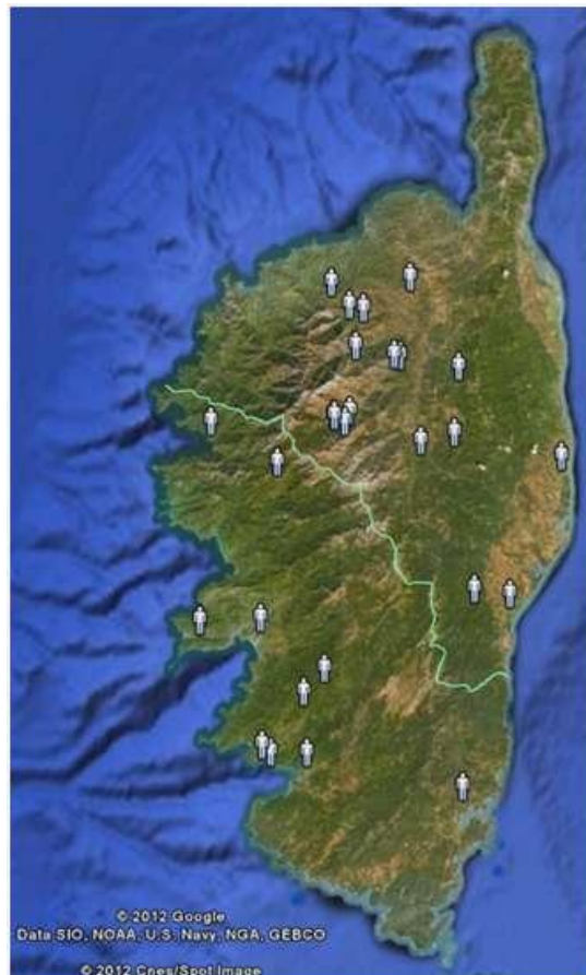
Figure 1: répartition géographique des éleveurs rencontrés

Un certain nombre de thèmes ont été abordés avec les éleveurs, allant de la présentation générale de leur exploitation, à la description fine de leurs troupeaux, des conduites d'élevage et des circuits de commercialisation empruntés, en passant par la représentation qu'ils ont de la race bovine corse et leur perception de la filière bovine et de son organisation régionale.