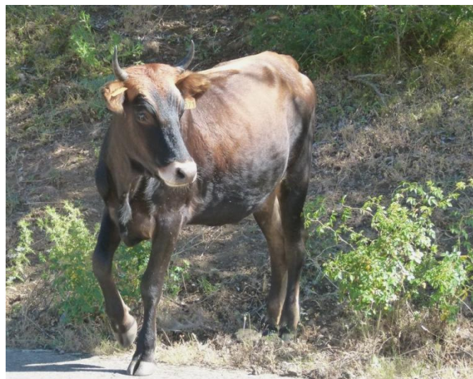
Illustration 1: vache corse dans le Ghjunsani, 2012

Il décrit une large fourchette de taille et de poids allant d'animaux de moins d'1m à 1m20 avec un poids vif adulte pouvant varier de 150 kg à 300 kg. Les taureaux en bonne condition quant à eux pèseraient autour de 500-550 kg.