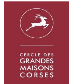
Illustration 5: logo du cercle des grandes maisons corses