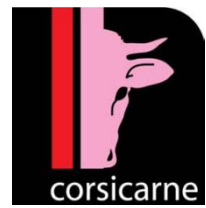
Illustration 2: logo Corsicarne

Ces catégories souffrant d'un manque de définition et de l'absence d'un réel cahier des charges, ont évolué. Le vitellonu a disparu. Le manzu a absorbé cette catégorie ainsi que les vitelli déclassés maintenus plus longtemps dans le troupeau. Par conséquent, le manzu est devenu une catégorie fourre-tout aux produits très hétérogènes, ce qui a contribué à dégrader son image. La marque a échoué dans l'homogénéisation de la qualité des carcasses arrivant à l'abattoir et n'a pas permis une réelle différenciation du produit pour le consommateur.