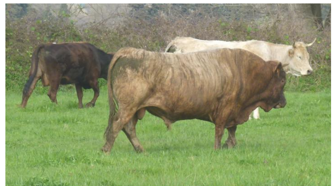
Illustration 4: taureau à la robe sainata d'Abbatucci, 2012