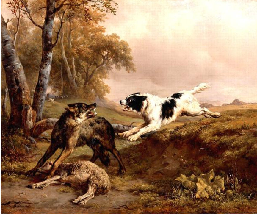
Illustration hors texte : Jacques Raymond Brascassat (1805-1867), le loup. Huile sur toile.