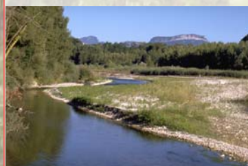
RN des Ramières (Drôme), RN de Nohèdes (Pyrénées Or)