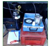
Ci-dessus : outil de mesure du potentiel hydrique par chambre à pression Scholander. Ci-dessous : influence d'une plante de couverture sur les populations d'acariens phytophages en verger d'agrumes. La plante de couverture par rapport à un sol nu (pratique de l'agriculteur) semble être un refuge des prédateurs naturels ( Phytoseiidae ) de ce ravageur car les phytoséides sont moins fréquents sur les mandariniers associés.