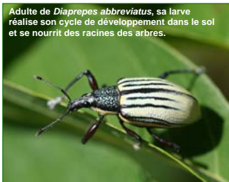
Adulte de Diaprepes abbreviatus , sa larve réalise son cycle de développement dans le sol et se nourrit des racines des arbres.