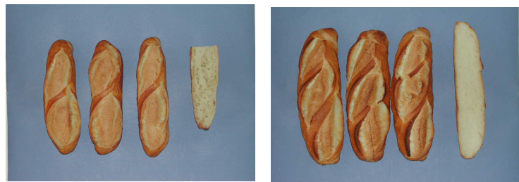
Pain de tradition

Les deux types de pain fabriqués avec la même variété à 9% de protéines présentent un aspect extérieur similaire, avec des grignes bien jetées et développées.