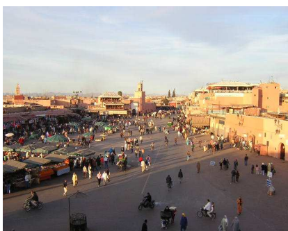
Place Jemaa El-Fna (Marrakech)

A l'heure où l'essentiel de la valeur ajoutée est désormais réalisée dans le secteur des services, il semble intéressant de mettre en exergue l'activité du tourisme pour nous interroger sur la croissance et les institutions dans le cadre de cette activité aux spécificités bien nombreuses. Le développement rapide et spectaculaire du secteur du tourisme ( 25 millions de touristes internationaux en 1950, 700 millions en 2000 et 1,6 milliards en 2020 ), s'est accompagné d'un impact environnemental important. La prise de conscience de la place essentielle de l'environnement pour le secteur du tourisme est à relier avec la mise en évidence des limites, voire de l'obsolescence d'une offre touristique standardisée et de masse.