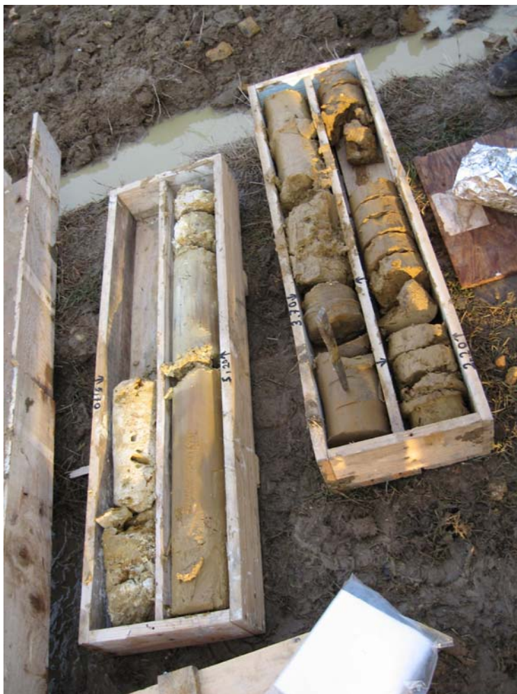
Figure 3: photo des carottes prélevées lors le l'installation d'un piézomètre

3). Des carottes de sols ont été extraites à différentes profondeurs, au niveau des couches.