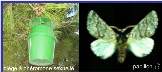
Piège à phéromone