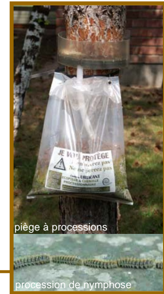
Ecopiège à processions