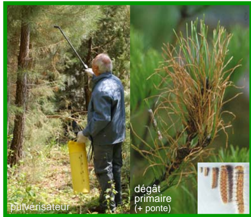
Insecticide microbologique à base de Bacillus thuringiensis kurstaki (Btk)