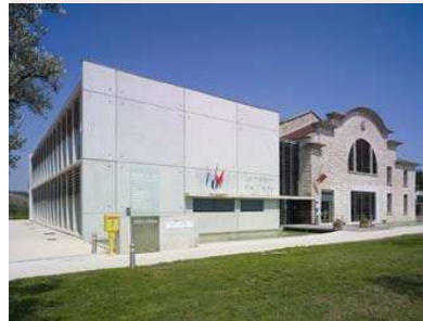
fig. 274 – Maison de l'eau installée dans l'ancienne cave coopérative, Allègre-les-Fumades (30).