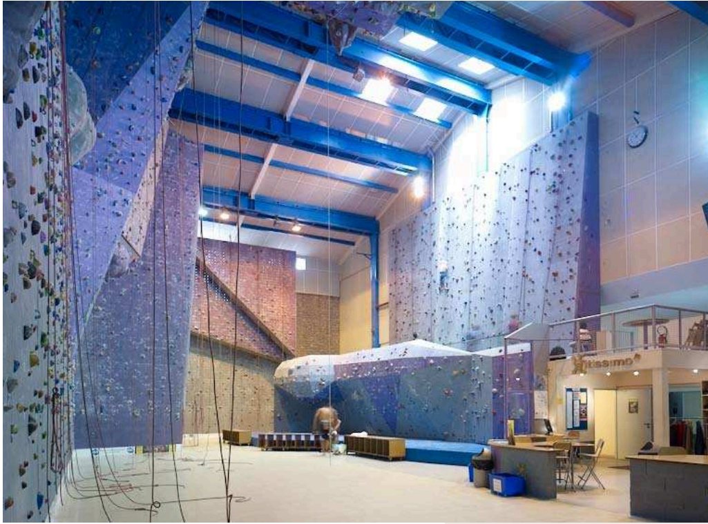
fig. 275 – Mur d'escalade installé dans l'ancien hall de la cave coopérative de Grabels (34, J. Rouquier, 1949).