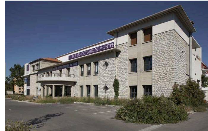
fig. 273 — Ancienne cave coopérative Saint-Cléophas à Montpellier (34, Cassan, 1929) : façade du bâtiment construit par les frères Rodier en 1946.

Lorsqu'elle a été acquise par la commune, l'ancienne cave est souvent proposée comme cadre architectural pour un projet communal et l'accueil de services publics. Les projets se multiplient depuis une dizaine d'années et des réalisations commencent à être médiatisées : espace multimédia réalisé en 2006 dans l'ancienne distillerie coopérative de Bizanet (11), salle polyvalente et des associations en construction depuis 2007 à Beaulieu (34), maison des jeunes et de la culture inaugurée en 2009 à Maugeio (34), en cours de réalisation à Ceyras (34) ou Mudaison (34), envisagées avec un musée à Murviel-lès-Montpellier (34)... À Montpellier, après l'accueil d'artistes jusqu'en 2003, l'ancienne coopérative a été réhabilitée pour abriter des séminaires et les locaux de l'ESCAIA, une école supérieure formant des cadres pour les coopératives agricoles (fig. 273).