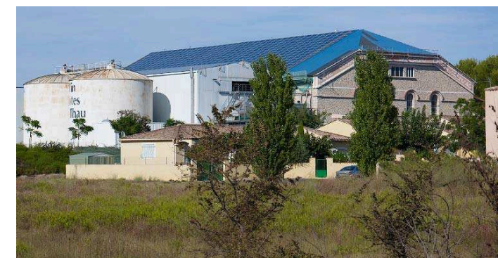
fig. 266 – Cave coopérative de Florensac (34). Couverture photovoltaïque installée en 2009 sur la cave construite par Brès en 1934.