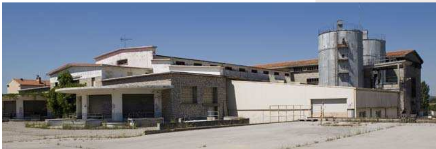
fig.277 — Ancienne cave coopérative de Gigean démolie en 2008 (34, J. Rouquier, 1939).

nels pour renforcer le lien du vin au lieu et à son histoire, et pouvant ou non faire face au coût de nouveaux investissements dans ces bâtiments. Dans un nombre croissant de cas, la commune a le jeu en main et mène le débat public sur l'avenir de la cave. La plupart des projets récents voient aussi l'intervention décisive d'une communauté de communes ou d'agglomération (par exemple pour Montpellier et Nîmes). C'est une échelle territoriale où l'action politique locale se trouve souvent plus en cohérence avec la stratégie des nouvelles coopératives multisites.