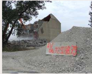
fig. 267 — Cave coopérative de Dions (30) : Saint-Père, architecte, 1929. Démolition de la cave en 2008.

Dans plusieurs projets, vente et démolition du bâtiment sont avant tout motivées par une stratégie de développement de la société coopérative elle-même. À Celleneuve (quartier de Montpellier dont la coopérative a été absorbée en 1980 par celle de Saint-Georges-d'Orques) la démolition du bâtiment de 1938 (fig. 268) et la vente d'une partie du terrain pour un projet immobilier ont permis de financer la