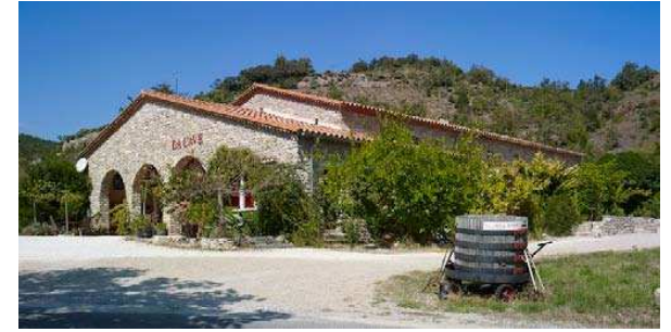
fig. 276 – Ancienne cave coopérative de Massac transformée en gîte rural (11, R. Villeneuve ?, 1951).

une pour la cuisine, une pour la salle à manger, la troisième pour le salon, les chambres étant disposées au-dessus (fig. 276). À Espérasa (11) ou Caveirac (30), des logements ont été construits pour la location, nécessitant comme à Massac le percement de fenêtres dans les murs latéraux. À Sommières (30), l'ancienne cave coopérative a été l'objet d'un projet ambitieux pour installer un ensemble de commerces (assurance, banque, fleuriste, boulanger) et de professions libérales (médecin, orthophoniste, infirmière, comptable...). La valeur architecturale du bâtiment se prête aussi à des activités ayant une dimension artistique ou artisanale : exposition et atelier d'art à Alénja (66), édition et imprimerie d'art (Encre et Lumière) à Cannes-et-Clairan (30), exposition et ventes de livres à Montolieu (11) où les cuves ont été transformées de manière originale en bibliothèque.