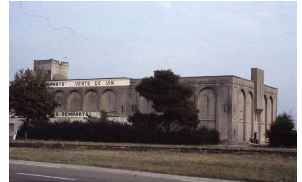
fig. 270 — La cave d'Aigues-Mortes, construite par Paul en 1913, devant les remparts classés, a été démolie en 2007.