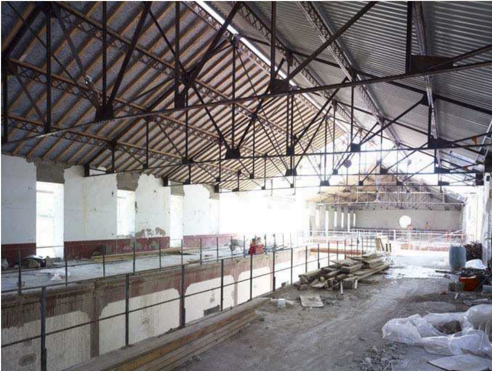
fig. 272 — Ancienne cave coopérative de Bélesta (66) en cours de réhabilitation.

d'art et lieu d'évènement culturel, en conservant au delà du nom (La cave) une orientation vinicole. Non loin de là, l'ancienne coopérative de Congénies (30) est devenue un restaurant (Chez Véro) où la dégustation des vins locaux est associée à des spectacles et une programmation musicale dynamique.