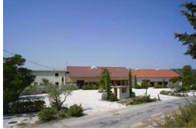
fig. 271 — Vue du Chais Michel, ancienne cave coopérative de Collorgues (30).

Cette association entre vins, gastronomie et culture peut aussi être conduite sans lien direct avec la production des vins d'un domaine. C'est le cas de plusieurs projets entre Nîmes et Montpellier, où l'arrachage viticole a été important mais où les activités culturelles autour du vin ont été relancées, incitées par la forte croissance démographique locale : à Saint-Just (34), la cave coopérative de 1911 a été restaurée comme galerie