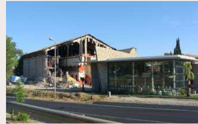
fig. 269 — La cave de Celleneuve en cours de démolition. Seul le caveau moderne (à droite) sera conservé.