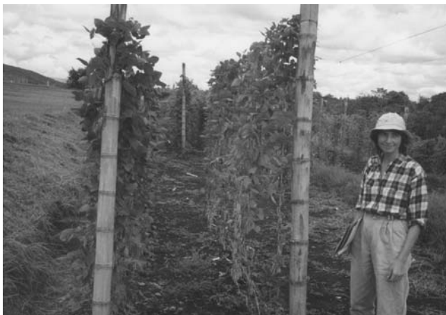
Production de haricots à rames pour les grains en Colombie.

H.B. — L'espèce sauvage est originaire de l'Amérique du Sud et de l'Amérique centrale. On trouve encore certains de ses représentants dans deux zones géographiques bien séparées : la première dans la partie de la cordillère des Andes située au nord de l'Argentine, la seconde sur les hauteurs situées au Mexique. Les haricots qui viennent de ces contrées se distinguent entre eux par des caractères morphologiques et biochimiques, à la suite d'une séparation sans doute très ancienne, antérieure au processus de domestication.