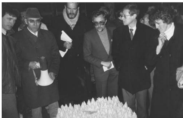
Les visiteurs dans la salle de forçage : le forçage sans terre en bac hydroponique.

H.B. — Oui, cela peut arriver, mais certaines d'entre elles ne sont pas liées au système de production lui-même. La seule façon de faire de l'endive de qualité, en hydroponique, est de respecter les températures de forçage et surtout les durées de forçage. Or actuellement, les endiviers sont pris dans un ensemble de