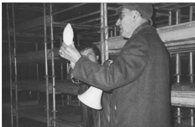
Vue de la salle de forçage.

pas à ce qu'on bouleverse le système de forçage. Mal préparés à produire des semences, nous nous y sommes mis malgré tout. Nous souhaitons produire des semences techniquement bonnes. Mais les champs mis à notre disposition étaient souvent infects. Il fallait d'abord faire une rangée d'un parent, une autre avec l'autre parent. C'était difficile ! Il fallait "faire du planchon", c'est-à-dire un semis d'août destiné à rester en place durant l'hiver pour être repiqué en pépinière, au printemps. Il faut reconnaître que nous sommes allés souvent au début dans le brouillard.