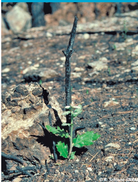
⑧ Rejet d'un chêne vert après feu.