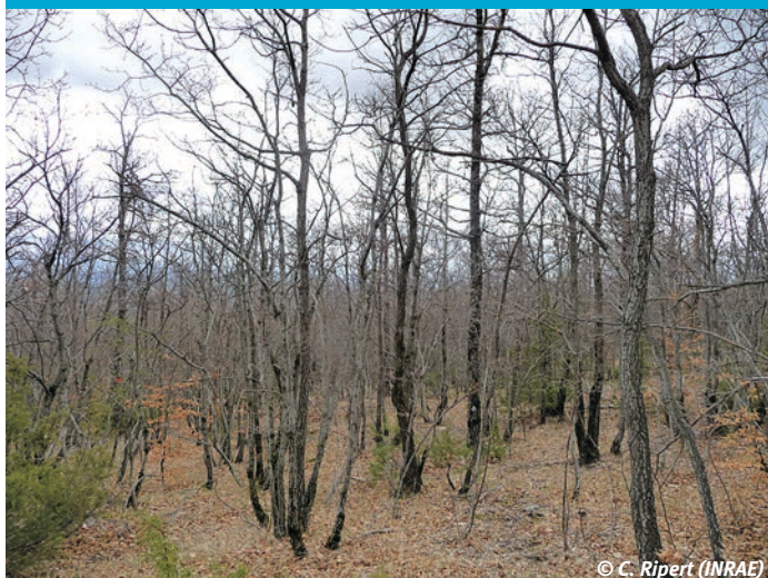
4 Taillis de chêne éclairci : la régénération est très faible ou absente.

Même lorsque ces limitations sont franchies et que les plantules émergent, leur croissance est difficile (photo 4) et leur survie est aléatoire. Ainsi, dans des expérimentations conduites sur le chêne pubescent (Bourdenet et al. , 1996 ; Prévosto et al. , 2013), les éclaircies pratiquées dans les vieux taillis ou dans les futaies sur souche afin de provoquer la régénération ont montré une installation initiale de semis. Cependant, au bout de quelques années, les semis n'ont pas survécu et les raisons de cette mortalité restent à élucider. Des difficultés similaires de régénération ont été notées pour le chêne vert (Ducrey, 1996). En attendant d'inventer des trajectoires qui permettent d'obtenir une régénération naturelle, il semble important de maintenir des coupes de taillis régulières qui restent le seul moyen efficace pour rajeunir les peuplements.