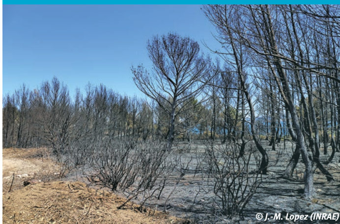
⑥ Peuplement de pin d'Alep après incendie.