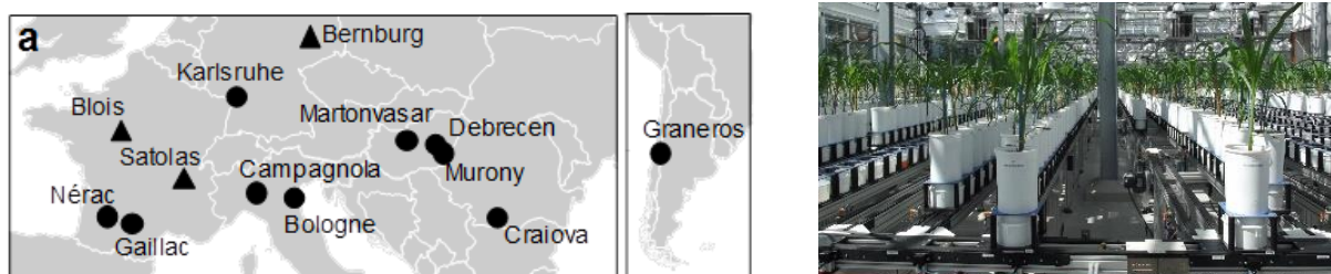
Figure 2 : Collecte de données dans des champs expérimentaux et en plateforme de phénotypage

Nous avons cherché à répondre à ce défi (Millet et al. , 2019) en combinant des mesures en conditions contrôlées pour des centaines de plantes, des essais en parcelles d'agriculteurs et l'utilisation d'un modèle. Nous avons semé 246 variétés de maïs dans 25 sites situés dans 5 pays européens et au Chili (Figure 2). Chacun de ces champs était muni de capteurs permettant de mesurer les conditions climatiques. En fin de saison, nous avons évalué la récolte et le nombre de grains de chaque variété. A partir de cette masse de données, nous avons établi un modèle statistique qui permet de prévoir le rendement des variétés de maïs en fonction de leurs gènes et des conditions environnementales, en utilisant les caractères mesurés en plateformes de phénotypage (Figure 2). Ce modèle permet de prédire le rendement de milliers de variétés de maïs avec plus de précision que les méthodes utilisées actuellement, y compris pour de nouveaux climats et variétés non testés expérimentalement. Il pourra devenir un outil de décision permettant aux agriculteurs de mieux choisir leurs semences. Il pourra aussi être utile aux semenciers pour adapter leur catalogue de semences aux conditions climatiques des diverses régions européennes. Ainsi, les agriculteurs pourront se prémunir contre les pertes de rendements que prévoient certains scénarios climatiques.