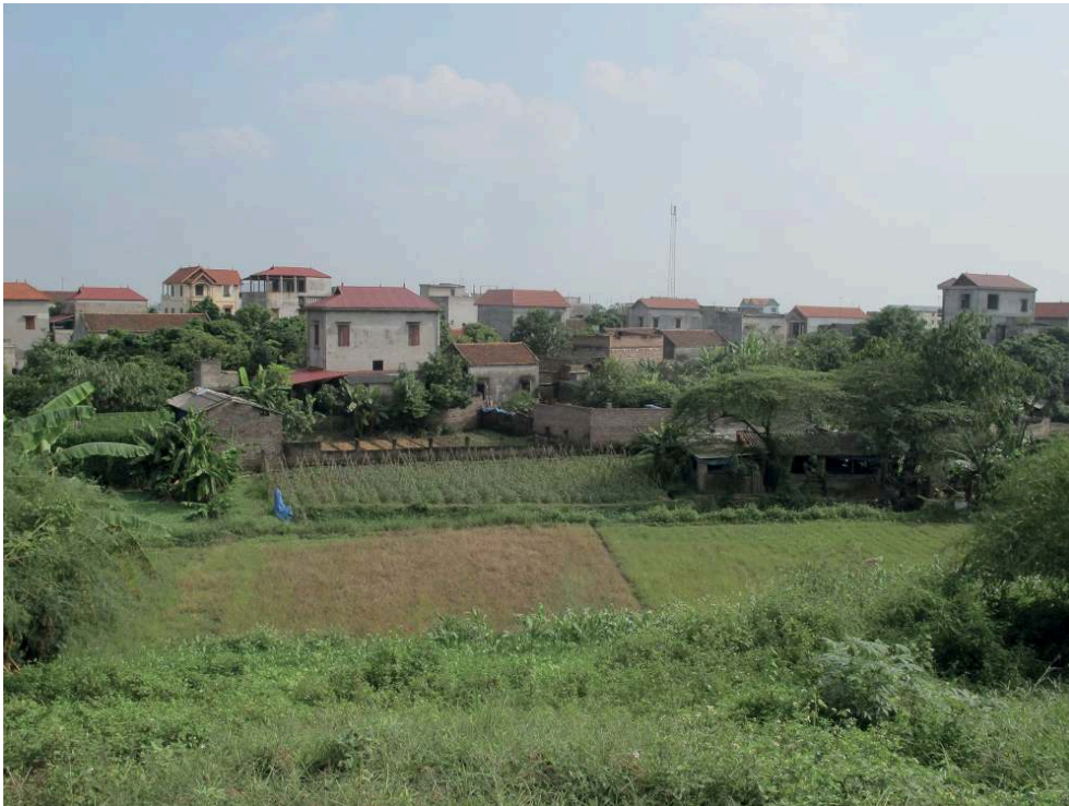
Photographie 4 : Bâtiments d'élevage à la lisière entre espace urbain et zone de culture en périphérie d'Hanoï

produisant des légumes, des fruits, du poisson et des fleurs grâce à la gestion des effluents d'élevage urbain (Kato, 2012 ; Cesaro, 2019). Mais l'avenir de cette ceinture est remis en cause par l'étalement de la ville et son développement économique (Sautier et al., 2014)