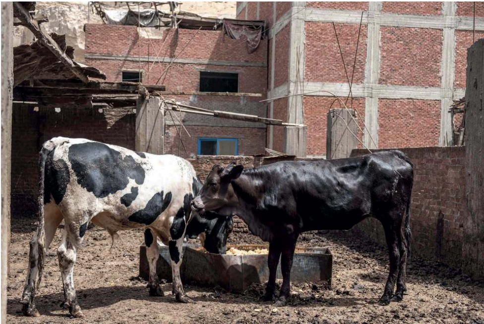
Photographie 2 : Vaches laitières sur les toits du Caire