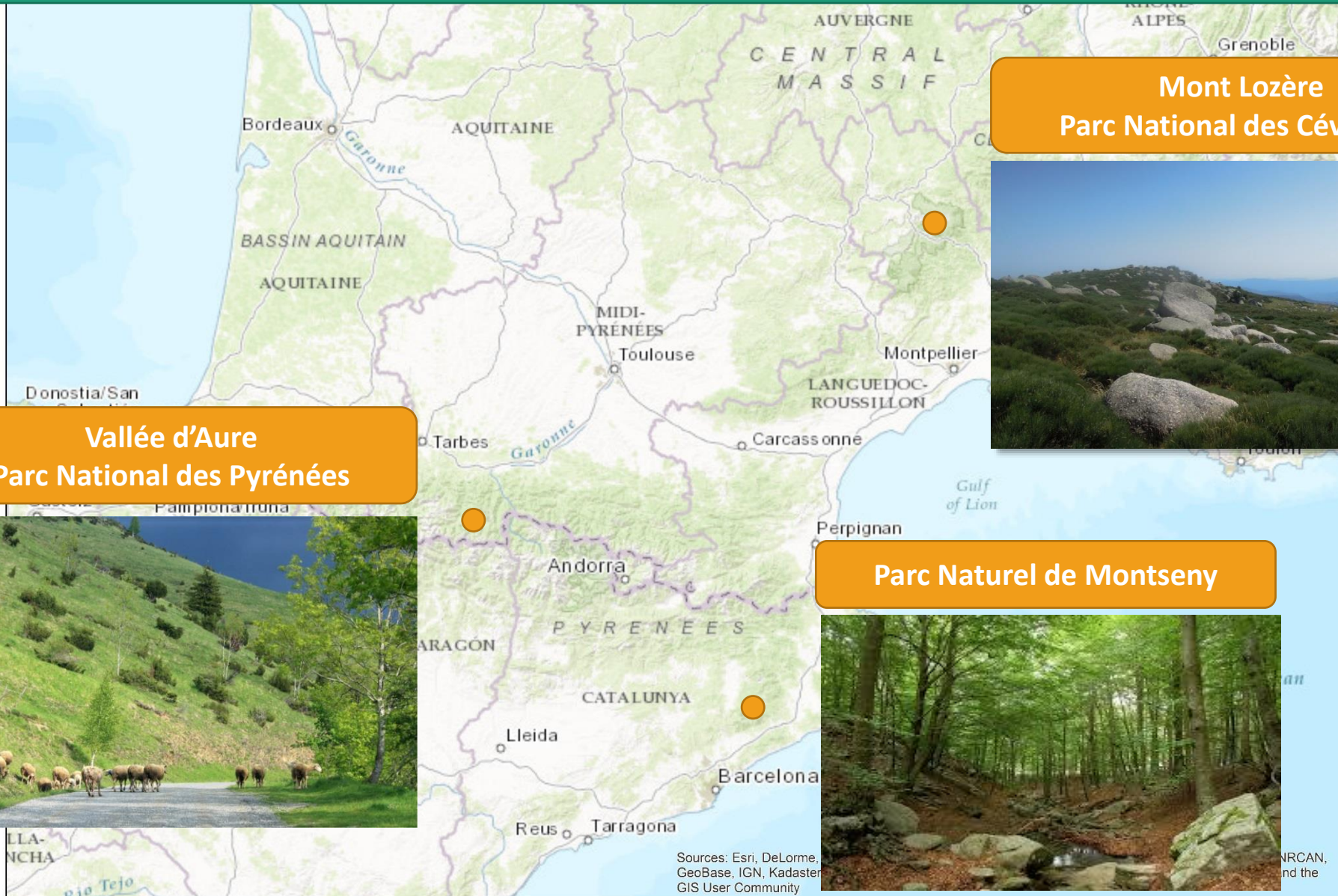
Mont Lozère Parc National des Cévennes