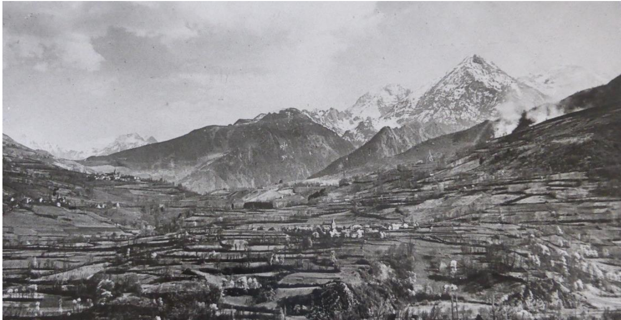
Années 1950