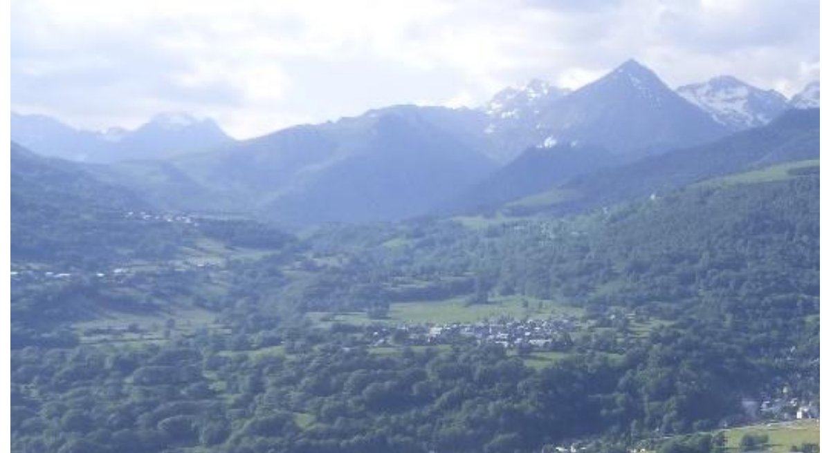
2015 (+ 18% de forêt)

“ l'estive (...) c'est un patrimoine, nos grands-parents nous l'ont transmis et on a le devoir de la transmettre à nos enfants dans le même état » (Eleveur )