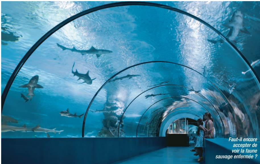
Faut-il encore accepter de voir la faune sauvage enfermée ?