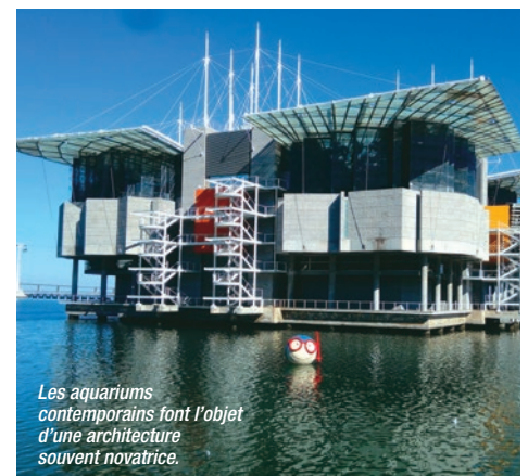
Les aquariums contemporains font l'objet d'une architecture souvent novatrice.