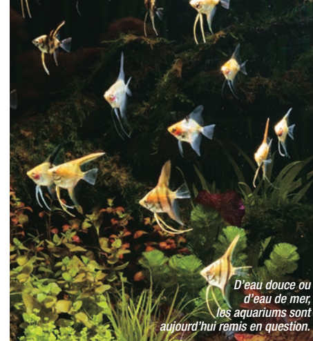
D'eau douce ou d'eau de mer, les aquariums sont aujourd'hui remis en question.