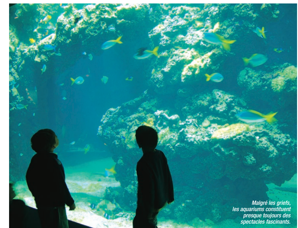
Malgré les griefs, les aquariums constituent presque toujours des spectacles fascinants.