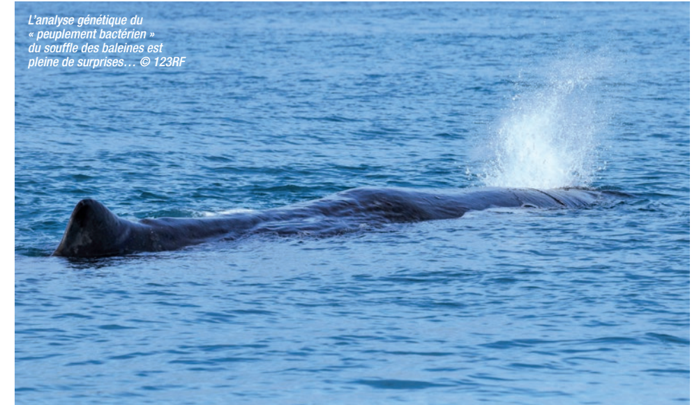
L'analyse génétique du « peuplement bactérien » du souffle des baleines est pleine de surprises...

À noter que ces drones de type hexacoptère peuvent aussi être utilisés à d'autres fins, typiquement pour faire des photos/vidéos des animaux. D'ailleurs, Dawson et ses collègues publiaient aussi en novembre 2017 dans Frontiers in marine science l'application d'une caméra embarquée et d'un système GPS + LIDAR ( Global Positioning System + Light Detection and Ranging ) sur ce type de drone pour photographier et mesurer précisément les cétacés en surface ; ce type de mesure (taille, poids) constituant des paramètres clés pour l'étude biologique/écologique qu'il est souvent difficile voire impossible d'obtenir sur la faune sauvage. ■