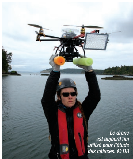
Le drone est aujourd'hui utilisé pour l'étude des cétacés.

Bon nombre de populations de baleines sont considérées comme des espèces en danger d'extinction, si bien que leur conservation et gestion dépendent très largement de notre compréhension des relations existant entre perturbations d'origine humaine et santé. L'idée de collecter des échantillons microbiens émanant du souffle des baleines est donc facile à comprendre a priori : le système pulmonaire est le site privilégié de diverses infections bactériennes chez les cétacés. Collecter et analyser ces bactéries peut donc être très utile pour connaître l'état de santé des animaux.