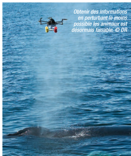
Obtenir des informations en perturbant le moins possible les animaux est désormais faisable.

Pour revenir à nos baleines, on comprend aisément qu'échantillonner ces bactéries est une autre paire de manches. Amy Apprill et ses collègues ont utilisé un drone de type hexacoptère permettant de récupérer de manière non-invasive cette flore microbienne, en guidant l'appareil au-dessus du souffle de deux populations de baleines à bosses ( Megaptera novaeangliae ), 17 individus à Cape Code dans les eaux côtières du Massa-