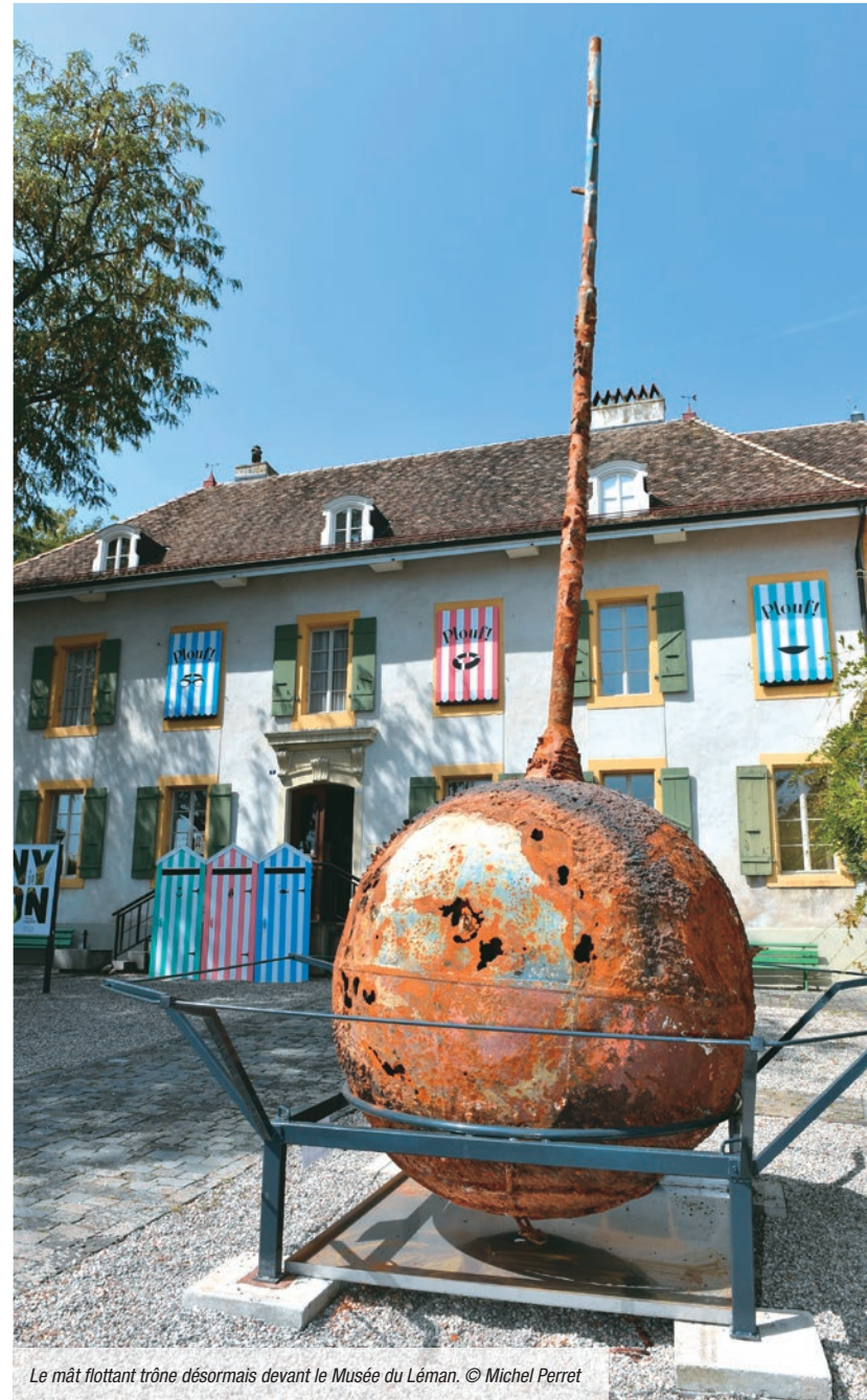
Le mât flottant trône désormais devant le Musée du Léman.