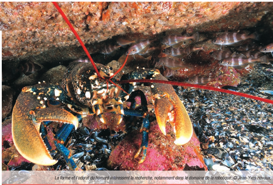
La forme et l'odorat du homard intéressent la recherche, notamment dans le domaine de la robotique.