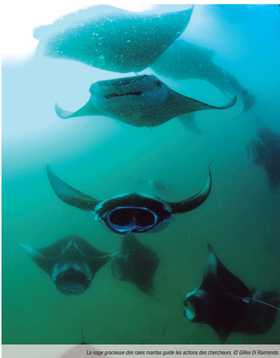
La nage gracieuse des raies mantas guide les actions des chercheurs.