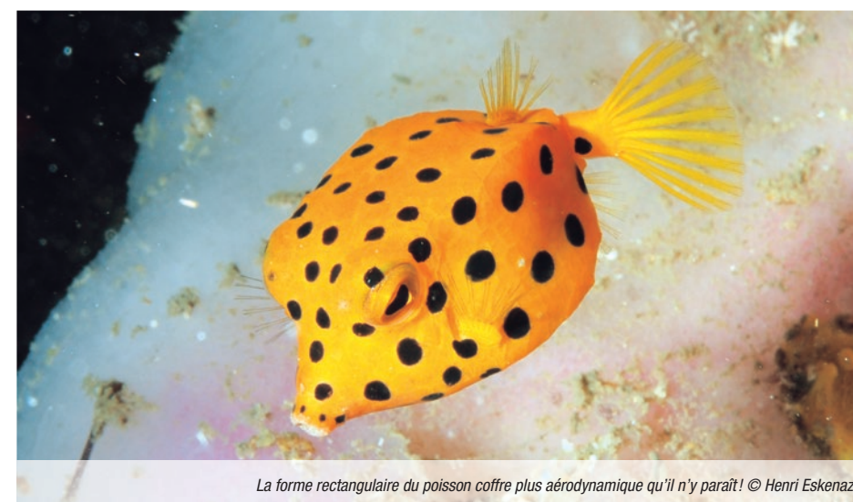
La forme rectangulaire du poisson coffre plus aérodynamique qu'il n'y paraît!

Plus anecdotique, les combinaisons de nage FastSkin et LZR Racer, fabriquées par la compagnie Speedo et inspirées de la peau des requins, ont sûrement contribué aux records du nageur Michael Phelps il y a quelques années, avec leur capacité de réduire jusqu'à 25 % les frictions de la peau dans l'eau. Elles ont été interdites des compétitions depuis.