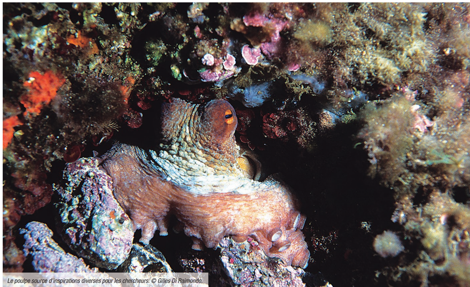
Le poulpe source d'inspirations diverses pour les chercheurs.

Ils sont une vraie source d'inspiration pour la technologie, à commencer par l'ormeau de Californie ( Haliotis furescens ) ! On a tous vu ces images de loutres en surface, cassant sur leur ventre avec des cailloux ces coquillages dont elles se délectent. Il faut dire que cette coquille tapissée de nacre argentée est plus dure que la céramique et qu'elle est donc très précieuse, notamment en joaillerie. L'ormeau a élaboré sa coquille et sa résistance depuis des millions