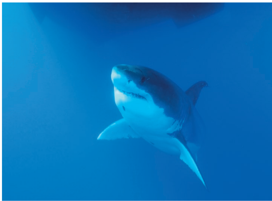
Les chercheurs tentent de reproduire l'épiderme des requins qui limite les turbulences dans l'eau et les frottements.

Cette réduction de traînée hydrodynamique s'accompagne également de la diminution du bruit généré par le déplacement de l'eau, un vrai plus pour un prédateur qui se délecte de poissons. Ces placoides défendent aussi leur hôte, servent de capteurs de l'environnement, etc. À ce jour, c'est surtout la réduction des turbulences et donc des frottements que les chercheurs tentent de reproduire. Cela a été testé pour l'Airbus A340 et pour divers types de bateaux avec des revêtements ou des peintures composées d'aspérités, de nanoparticules imitant donc les placoides.