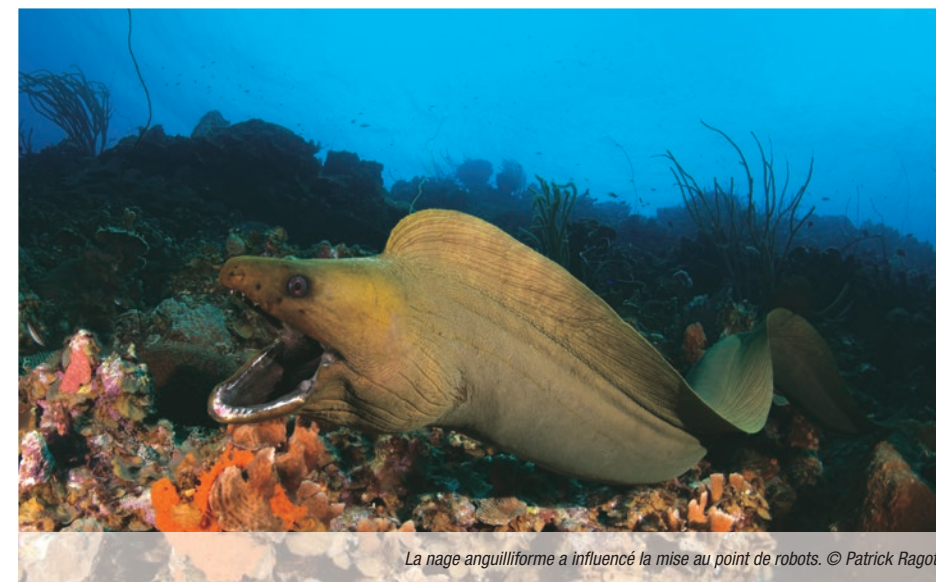
La nage anguilliforme a influencé la mise au point de robots.