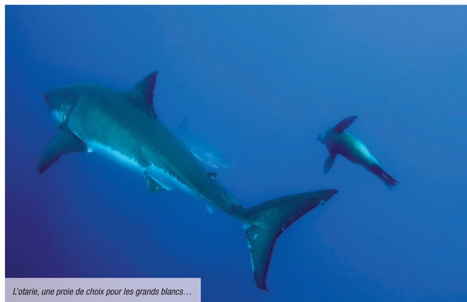
L'otarie, une proie de choix pour les grands blancs...

L'étude conduite par Alison Towner et ses collègues apporte donc des éléments nouveaux sur l'activité de chasse des requins blancs d'Afrique du Sud en fonction de leur sexe. C'est vraiment intéressant. En tout cas, bien plus intéressant qu'« Instinct de survie-the shallows » dont le slogan « certains jours, mieux vaut