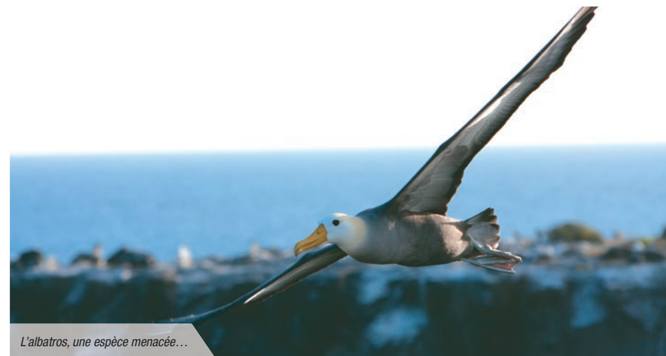
L'albatros, une espèce menacée...

Si les auteurs se plaisent à définir le passé (avant la fin du Pléistocène ou de l'Holocène) comme une époque de géants suivie par une époque marquée par la chasse à la baleine, c'est parce qu'on estime aussi aujourd'hui, rien qu'au niveau des mers, que le déclin des baleines a été de l'ordre de 66 à 99 %. Fixons les esprits avec un animal emblématique comme la baleine bleue ( Balaenopterus musculus ): ses effectifs dans l'hémisphère sud ont été réduits de 99 % par rapport à leur abondance historique à cause de la pêche commerciale et celle dite « scientifique ». Si on connaît donc les raisons de ce type de baisse massive, on s'était beaucoup moins intéressé jusqu'alors aux conséquences écologiques de tels déclinés, par exemple sur le mouvement (c'est-à-dire le déplacement, la redistribution, la remise à disposition) des nutriments. Peut-être aussi parce que l'on pensait cela d'une importance secondaire.