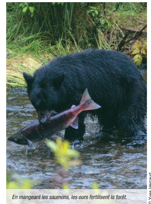
En mangeant les saumons, les ours fertilisent la forêt.