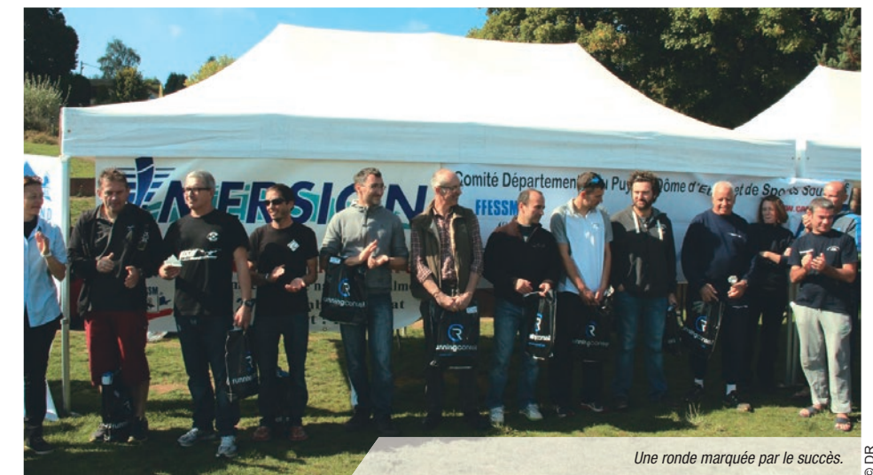
Une ronde marquée par le succès.

Le samedi 26, la commission secourisme du CODEP animait un atelier « secours en eau libre » les nageurs pouvaient se familiariser en situation réelle avec du matériel récemment acquis par la commission, une planche de sauvetage et une corde flottante.