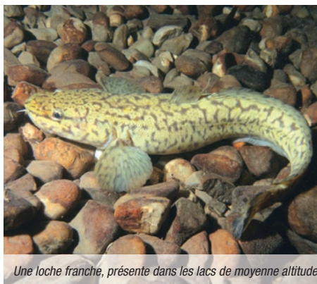
Une loche franche, présente dans les lacs de moyenne altitude.

Pour pallier les connaissances trop faibles en biologie, l'idée est de fabriquer des « ressources » pour les plongeurs (guides de palanquée mais pas que) sous la forme de nouveaux diaporamas types et vidéos sur la faune et flore lacustres ou encore sur le